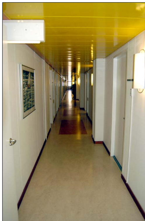
Ovan: Korridor plan 3 i Domstolarnas del. Nbm acc.nr 2005:214:37 Till vänster: Gult plåttak med orange lysrörsarmaturer på plan 4. Nbm acc.nr 2005:214:30

På plan 3 och 4 går inredningen i varmare färger och ursprungliga innertak finns kvar. Dessa består av gula brännlackerade, perforerade aluminiumribbor upplagda på en smal och en bredare orangelackerad aluminiumskena. I taken sitter orange lysrörsarmaturer. I övrigt är de flesta ytskikt nyare, genomgående i ljusa färger. I alla lokaler finns nyare golvlister i trä. Ursprungliga dörrar och dörrposter som tidigare haft starka kulörer är nu vitmålade. På plan 4 är innerväggarna mellan kontor och korridor försedda med glaspartier. Nya fikarum finns på alla våningar. Den centrala personalmatsalen finns på plan 6.