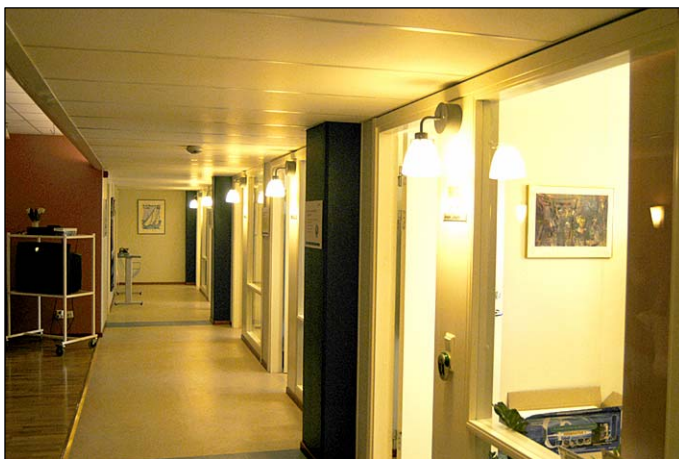
WSP:s lokaler på plan 5. Foto från söder. Nbm acc.nr 2005:214:16

MAX huvudkontors lokaler på plan 6 (tidigare häkte), är den hittills enda avdelningen med öppet kontorslandskap. Här finns inga bärande pelare som styrkt planlösningen. Man har inrett med ljusa, avdelande trämöbler, väggar är vitmålade och textilier går i rött. En varmt brun heltäckningsmatta mjukar upp lokalen och stora fönster släpper in mycket ljus. På plan 7 dominerar den allmänna avdelningen och WSP Managements lokaler av ljust trä och gråa nyanser på ytskikt och textilier. Den norra hälften av plan 7 upptas av ventilationsanläggningen.