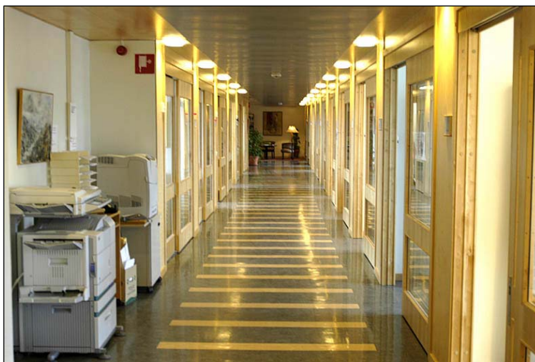
Åklagarmyndighetens korridor på platsen för det tidigare häktet. Glasade mellanväggar och stora fönster gör lokalen ljus. Nbm acc.nr 2005:214:09

Indelningen mellan polisiär och allmän del kan sägas stå sig även idag med skillnaden att den mittersta delen nu till större delen upptas av privata företag. Denna förändring började 1997-98 med att häktet som upptagit nästan hela våning 6 flyttade till Porsön i Luleå. Plötsligt stod man med stora tomma lokaler och den västra flygeln där det tidigare varit häktesceller, byggdes om för Åklagarmyndigheten. 38 Arkitekt var Gunnar Berg.