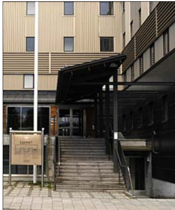
Domstolarnas entré, Skeppsbrogatan 41. Till höger om denna finns den uppbyggda terrassen och den uppglasade korridoren. Nbm acc.nr 2005:213:07

Entré 41 finns på terrassplanet väster om den sydöstra flygeln och nås via en trappa från trottoaren. Den markeras genom ett lutande, långt utsträckt skärmtak. Fasaden tillgängliggörs genom tydlig skyltning. Portar är utförda i glas med bruna aluminiumprofiler. De enkla, massiva fasaderna, de raka formerna och dominansen av brunt ger byggnaden ett officiellt, relativt anonymt utseende. Detta gör byggnaden onåbar och svår att ta till sig, vilket kan vara en av orsakerna till att den inte alltid varit så uppskattad.