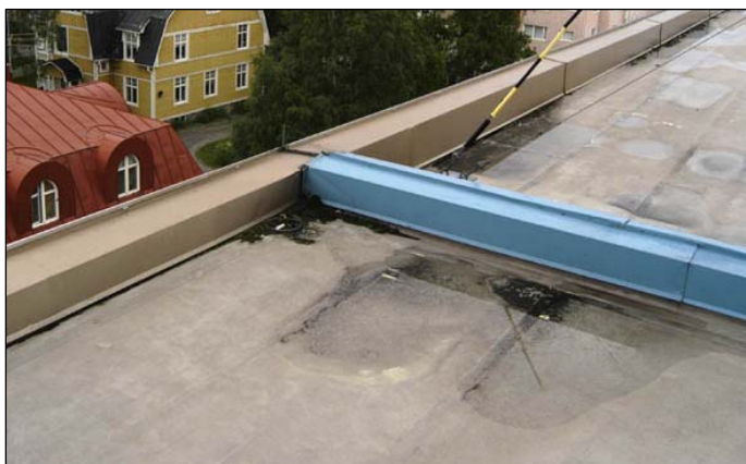
Del av taket och den upphöjda plåtlisten. Nbm acc.nr 2005:213:11

Det platta yttertaket täcktes av grå butylgummiduk och isolerades med en hård mineralullsskiva. Taket avslutades med en upphöjd kant täckt av falsad plåt med uppgift att hindra vatten från att rinna ner på fasaden. 55 Takavvattning sker med takbrunnar och invändiga stuprör. I systemhandlingarna för uppförandet står att gummiduken skulle beläggas med shingel men idag är gummiduken bar. Om shingel lades på taket är osäkert. 56