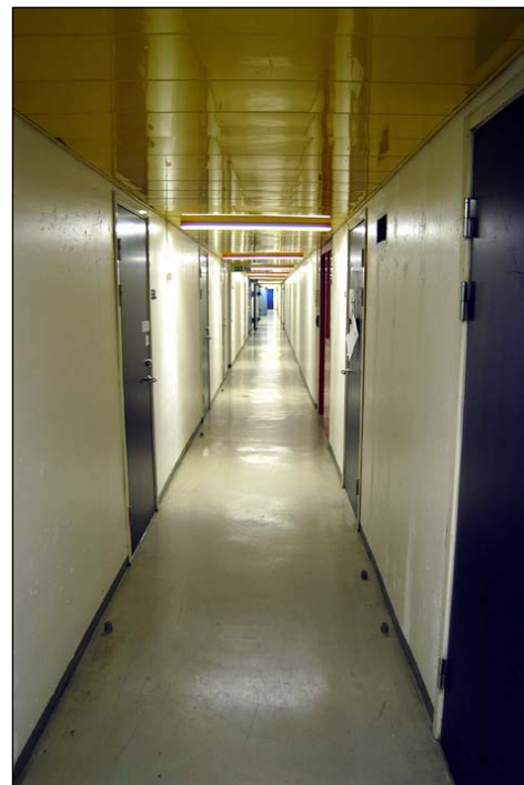
Suckarnas gång. Det gula plåttaket speglar belysningen och är ett intressant inslag i denna betongmiljö. Från väster. Nbm acc.nr 2005:214:01

På källarplan är känslan av ”underjord” och betong påtaglig. Här finns en näst intill ändlös korridoren som kallas Suckarnas gång . Den leder genom hela husets längd, från en hiss (”bushiss”) i den polisiära delen till en annan under tingsrätten. Denna väg fördes personer från häktet till rättegång och förhör på den tiden häkte fanns i huset. Tidigare fanns ingen avgränsande dörr i korridoren utan sikten sträckte sig genom dess hela längd. 49 Nu är den polisiära delen av korridoren avgränsad med en blå ståldörr.