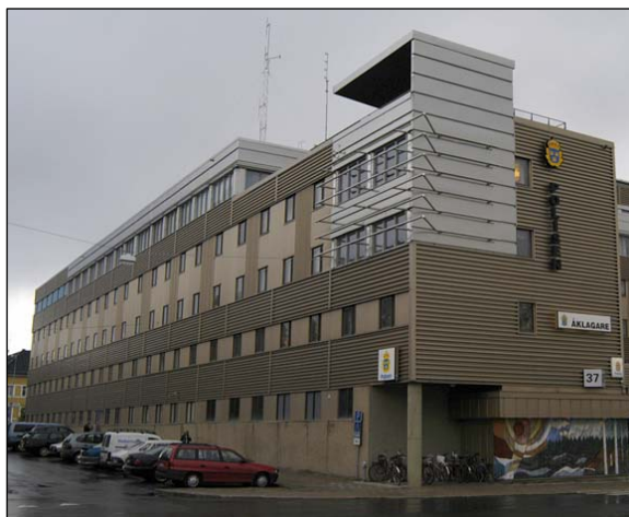
Foto från sydväst över västfasadens slutenhet, betonad av den höga sockeln och det regelbundna fasadmotivet. Nbm acc.nr 2005:213:01

Fasaden mot Skeppsbrogatan i söder är byggnadens framsida. Här finns de tre allmänna entréerna till fastigheten och Luleå Lokaltrafik har en busshållplats (hpl. Rättscentrum) vid Polismyndighetens entré. Mot de tre övriga gatorna finns inga synliga ingångar och här ger fasaderna ett intryck av slutenhet och baksida.