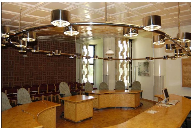
Översikt över tingssal 3. Interiören är i stort densamma också i sal 1 och 2. I taket de vita plåtkassetterna. Bänkinredningen är ursprunglig, stolar och armaturen i krom är nyare. Foto från sydväst. Nbm acc.nr 2005:214:34

Sal 1, 2 och 3 är större, ursprungliga tingssalar. Även dessa är renoverade, bland annat är tidigare bruna heltäckningsmattor ersatta av parkettgolv. Vita brännlackerade plåtkassetter med infogad lysrörsbelysning och väggbeklädnad i håltegel är ursprungliga, likt bänkinredning. Tingssalarnas mörka träfönster är ljudisolerade. I sal 2 finns ett gammalt fatalur samt åhörarbänkar från 1900-talets början när rådhuset var beläget i gamla stadshuset. Sal 4-6 är små, enkla och senare tillkomna. De är helt förändrade i slutet av 1990-talet.