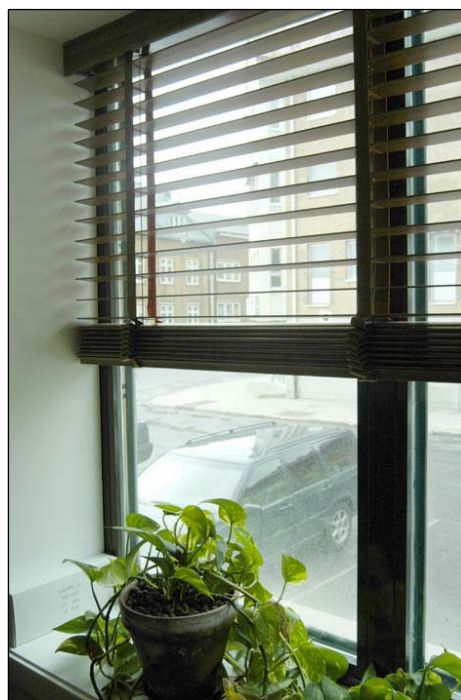
Fönster i nordvästra flygelgaveln i Polismyndighetens lokaler. Nbm acc.nr 2005:214:13

Ventilationsanläggningen placerades i en separat takupbyggnad, plan 7. Ventilationen skedde med lika mängder till- och frånluft och stor andel återvinningsluft. Byggnaden försågs med högspänd elkraft och anslöts till fjärrvärme med uppvärmning av rummen via termostatreglerade vattenradiatorer. Ventilationen ändrades år 2000.