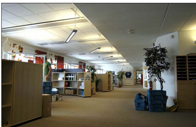
MAX huvudkontor. Inredningen utgörs av flyttbara kontorsöar. Här finns inget av ursprunglig planlösning eller tidigare ytskikt. Nbm acc.nr 2005:214:15