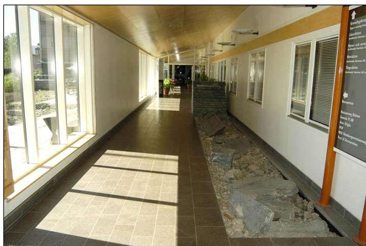
Den uppglasade korridoren mellan de två sydöstra flyglarna. I förgrunden ett vattenfall som ej är i bruk för tillfället. Till höger i bild den tidigare ytterväggen med ursprungliga fönster. Foto från öster. Nbm acc.nr 2005:214:28

1999 inleddes en omfattande renovering av myndighetens lokaler. Reception och väntrum byggdes om och de flesta yt-skikt byttes. Samtidigt byggdes mittentrén. 45