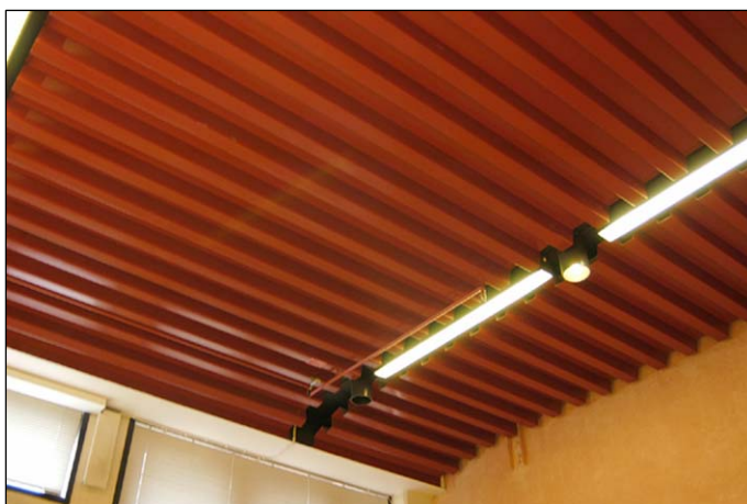
Entréhallens tak. Den röda plåten välvs mot väggens fönsterband. Nbm acc.nr 2005:214:08