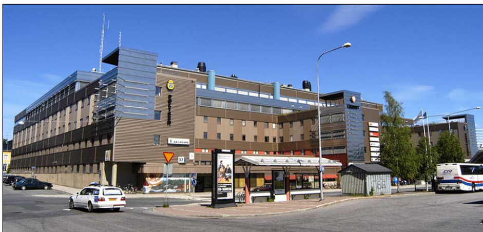
Översikt Lejonet från sydväst. I förgrunden delar av Luleå busstation i kvarteret Loet. Nbm acc.nr 2005:213:13

Lejonet är uppfört på förhållandevis kort tid och är skraddarsydd för de verksamheter som skulle inrymmas i byggnaden. Förändringar har skett främst under den senaste tioårsperioden men det övergripande uttrycket har inte påverkats i någon större utsträckning. Interiört har merparten av lokalerna byggts om eller renoverats men husets konstruktion gör att grundplanen till stora delar är oförändrad. Exteriört är utformning och ytskikt väl bevarade och även interiört finns ursprungliga material och ytskikt kvar i vissa avdelningar.