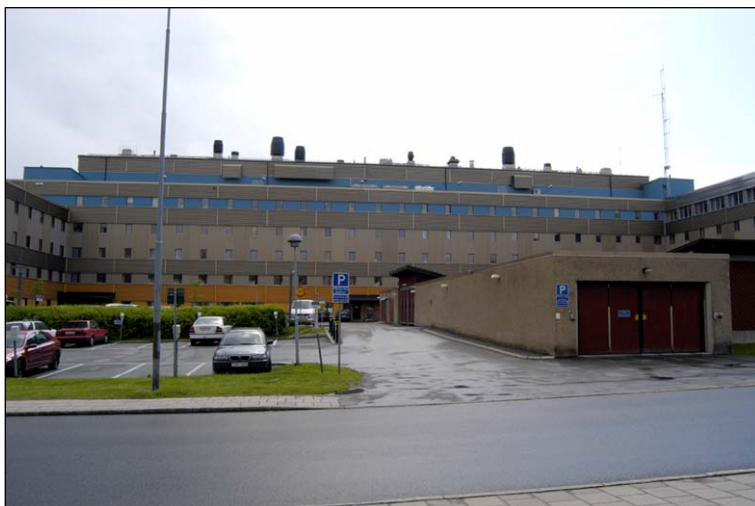
Översikt innergården från norr. På bilden visas den översta indragna våningen, de två flyglarnas olika höjd och till höger garageinfarten. Nbm acc.nr 2005:213:03