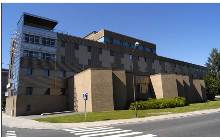
Östfasaden från sydost. Nbm acc.nr 2005:213:15