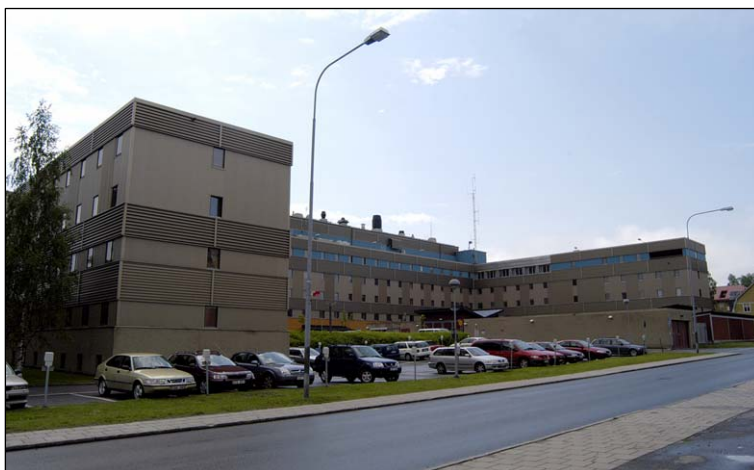
Från nordost med Magasinsgatan i förgrunden. Norrflyglarna, huvudlängans nordfasad, parkeringsplatser, gräsmattor, träd och trottoarer. Nbm acc.nr 2005:213:04

Lejonet är beläget i nordöstra delen av centrala Luleå, mellan Skeppsbrogatan i söder, Hermelinsgatan i väster, Magasinsgatan i norr och Prästgatan i öster. Det är den högsta byggnaden i omgivningen men eftersom de centrala delarna av Luleå sluttar ner mot norr och Lejonet ligger strax nedanför sluttningen, dämpas dess storlek något. Söder om fastigheten finns kvarteret Loet med Luleå busstation och i öster löper järnvägen med station och godsterminal.