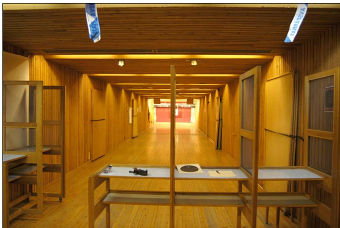
Översikt över polisens skjutbana. I förgrunden skjutbåsen. Nbm acc.nr 2005:214:02