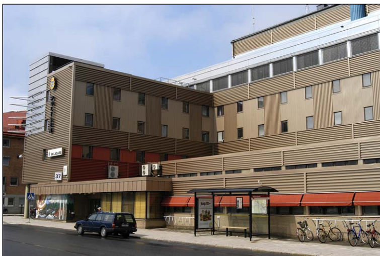
Terrasseringen mellan de två sydvästliga flyglarna. Här ser man även Polismyndighetens entré och övrig våningsindelning. Foto från sydost. Nbm acc.nr 2005:213:02

Fasaden är klädd i brun trapetsprofilerad aluminiumplåt i tre olika dimensioner. Den smalaste profilen tjänar som huvudtäckning och en bredare profil löper vertikalt med två fönsteraxlars mellanrum. Horisontellt delas fasaden in av den grövsta profilen som löper i breda band längs hela fasaderna. Den avslutar också fasaderna uppåt och täcker gavelpartierna på de tre sydliga flyglarna.