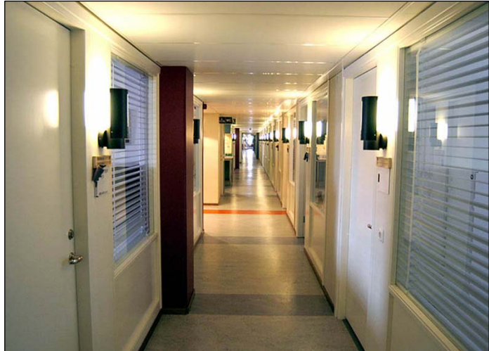
Korridor på plan 4 i Polismyndighetens lokaler. Här är de gula plåtinnertaken ersatta med vita skivtak. Foto från norr. Nbm acc.nr 2005:214:11

Kontorslokalerna på plan 2, 3 och 4 är relativt lika till planlösning och färgsättning. De är renoverade i början av 2000-talet och ytskikten är nya. Väggarna är vitmålade och bryts av med pelare målade i kraftiga färger som rött och blått. Avdelningarna är uppbyggda med en central hall i mitten av en lång, rak korridor med likadana kontorsrum på båda sidor. Korridoren avslutas i båda ändar av fönster som utgör viktiga ljuskällor i de långsträckta lokalerna. Kortare tvärkorridorer utgår från den centrala delen in i huvudlängan. Korridorgolven täcks av ljusa plastmattor med främst gråa tvärstreck. Vissa av väggarna mellan cellkontoren är utslagna för att skapa större kontor. Man har också tagit upp fönster i kontorsväggarna mot korridorerna för att göra lokalerna ljusare och luftigare. Planlösningen är i stort oförändrad sedan uppförandet.