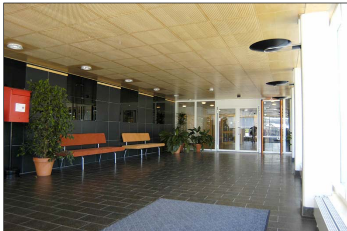
Entréhallen i den mittersta sydflygeln. Glaspartierna släpper in mycket ljus. Inredningen domineras av mörkt grå stensplattor i väggar och golv och ljust trätak. Foto från sydost. Nbm acc.nr 2005:214:25

De centrala delarna av huset är de mest förändrade. Tidigare fanns ingen entré i den mittersta flygeln utan enbart en korridor flankerad av rum. Entrépartiets väggar och golv är klädda med stenplattor. Innertaket är i ljust trä med infällda armaturer. Innanför entréhallen finns ett trapphus och till höger om detta når man den tillbyggda, glasade korridor som löper mellan de två östliga flyglarna, utanför den egentliga huskroppen. Här finns restaurang och Norrportens kontor. I dess avslutning österut finns entrén till Domstolarna. Restaurangen har mörkröd inredning, vita väggar och brunt kassetak i brandlackerad plåt.