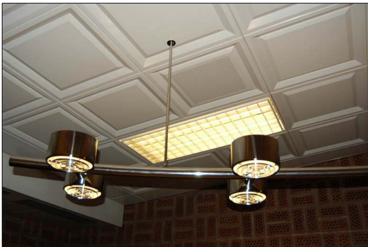
Kassettaket i tingssal 3 med infälld lysrörsarmatur. Nbm acc.nr 2005:214:29

Domstolarnas, Kronofogdemyndighetens och Polisens avdelningar domineras av själva planlösningen. De långsträckta korridorerna flankerade av cellkontor ger lokalerna en tydlig officiell prägel. Ursprungliga material och ytskikt som de gula plåt-taken i korridorer, kassettaken i tingssalar och restaurang och vissa golvmattor, väggfärger och dörrar som finns kvar sedan uppförandet ger tillsammans en bra bild av hur byggnaden en gång såg ut. De visar också hur nära