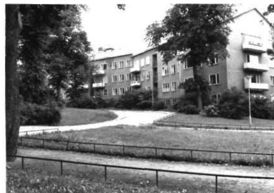
Fi 34 659