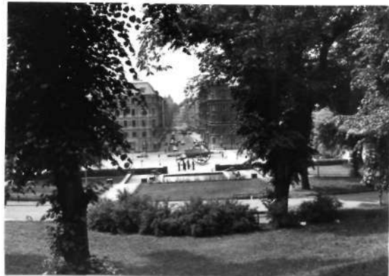
Fi 34 679 Eriksbergsparken