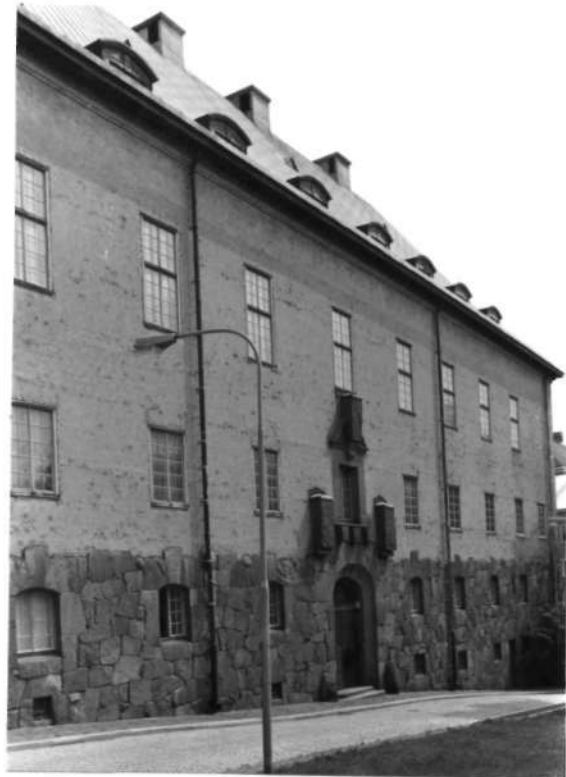
Fi 34677 Mot Eriksbergsplan