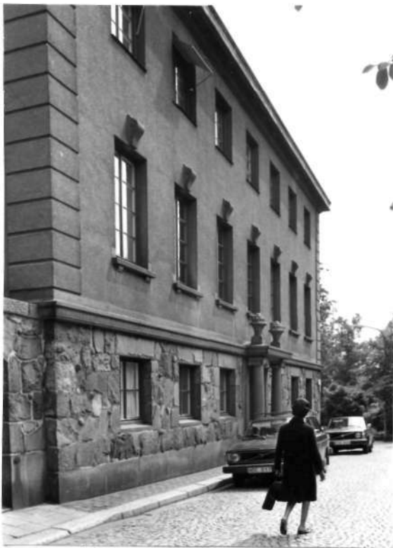
Fi 34 675