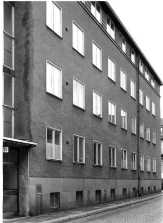
Fi 34 671