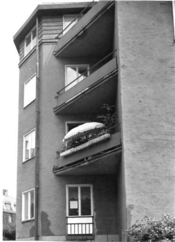
Fi 34 674