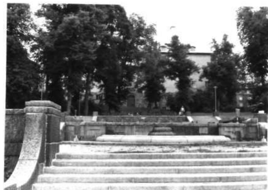
Fi 34 658 Eriksbergsparken