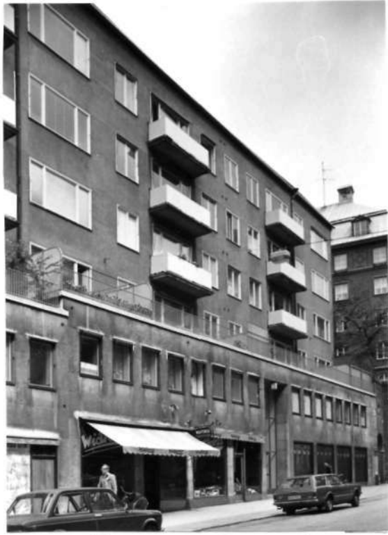
Fi 34 664