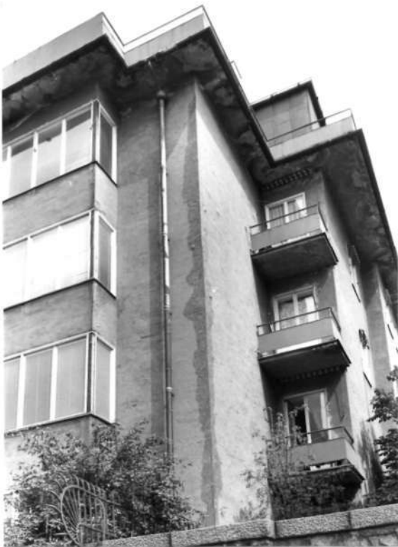
Fi 34 676