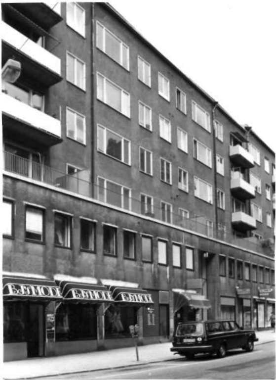
Fi 34 663 och -62 o. -61 Hus IV