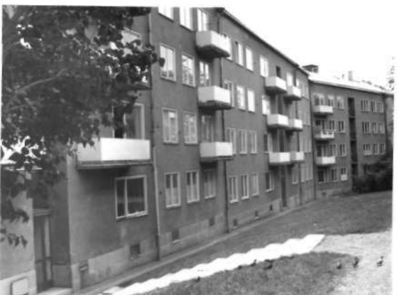
Fi 34 666