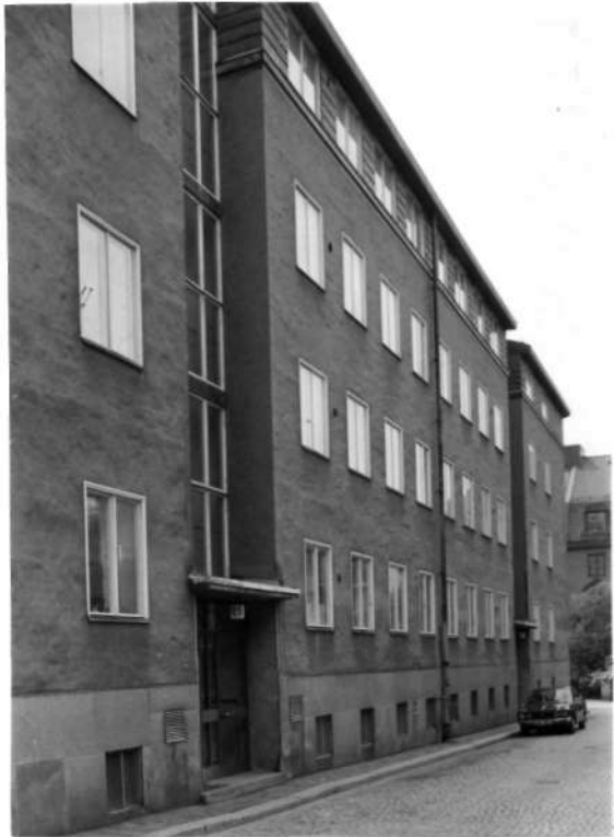
Fi 34 672 och -73