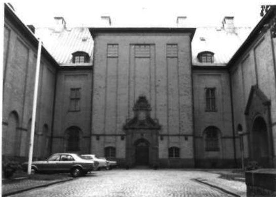
Fi 34 668 Eriksbergsgatan 17