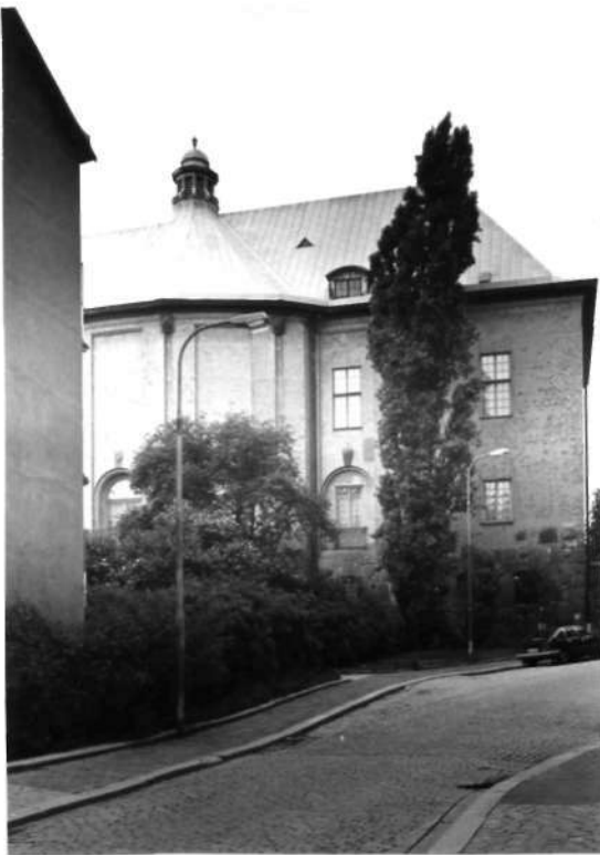
Fi 34 665 Eriksbergsgatan