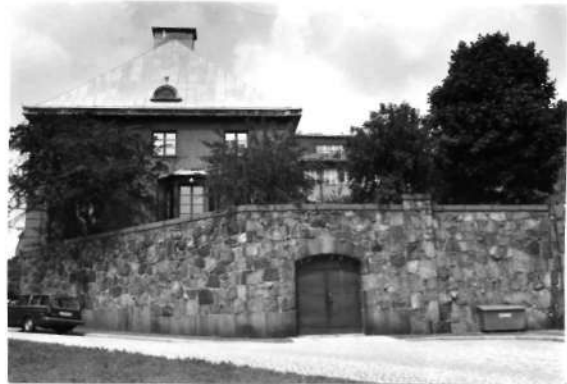
Fi 34 678