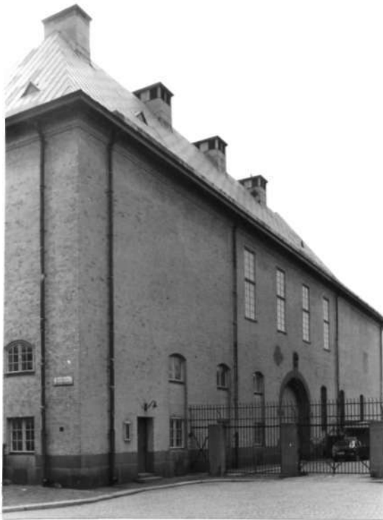
Fi 34 669 Eriksbergsgatan