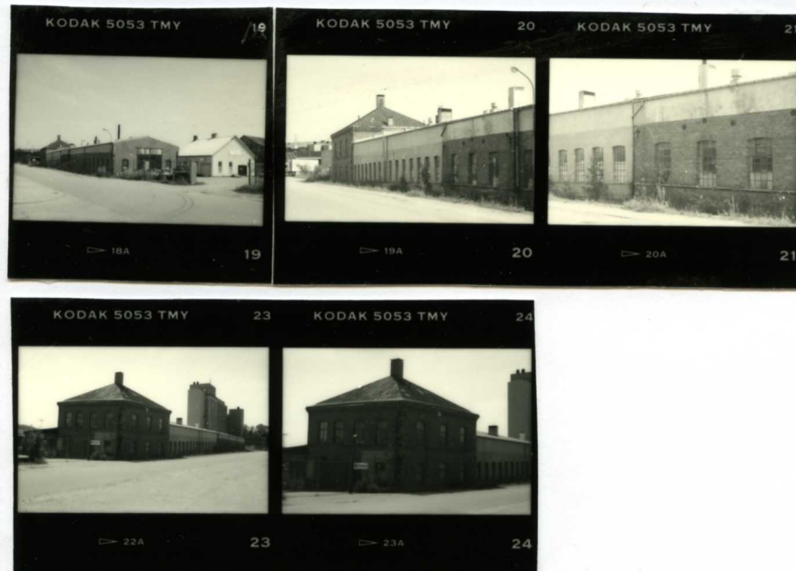
Foto Nr : VLM B 103.141 19-21, 23-24