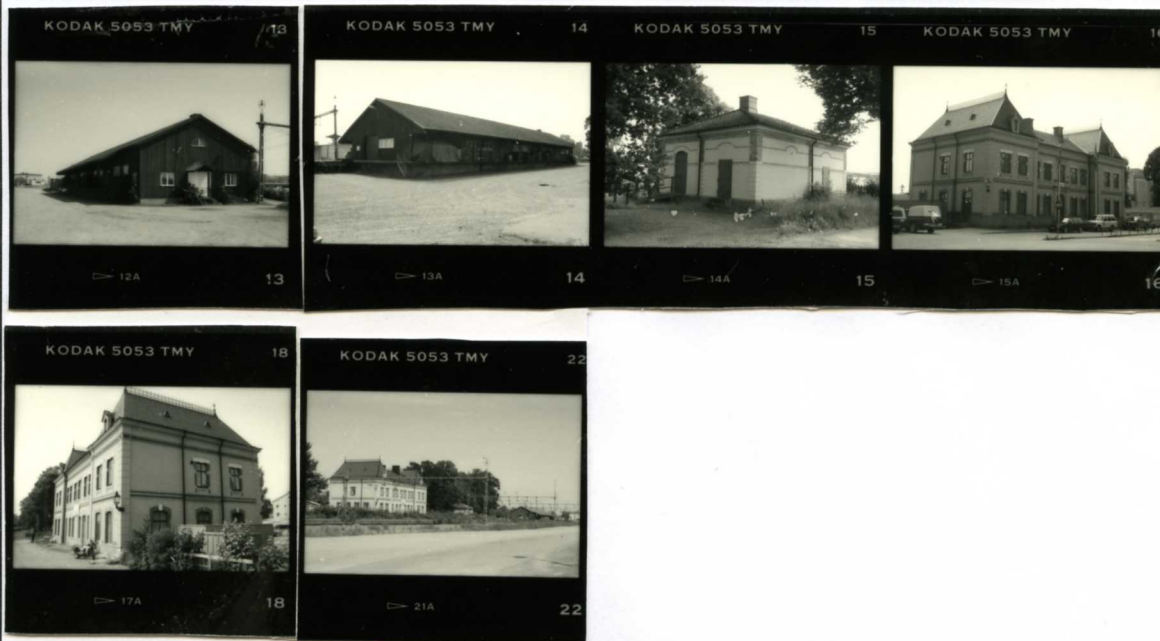
Foto Nr: VLM B 103.141 13-16, 18, 22