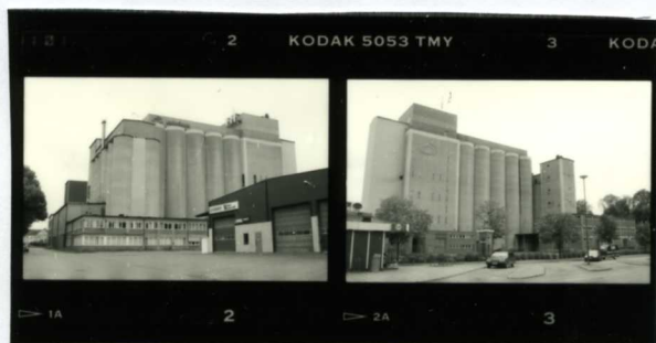
Foto Nr: VLM B 103.168 2-3