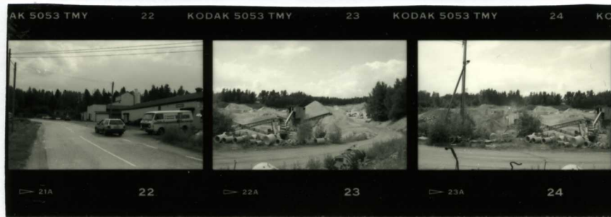
Foto Nr: VLM B 103.168 22-24