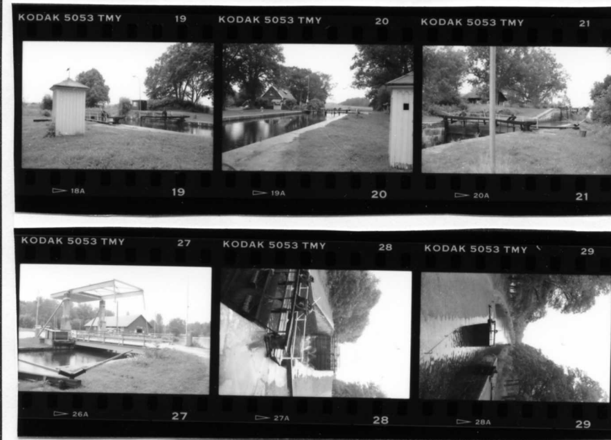
Foto Nr: VLM B 103.142 19-21, 27-29