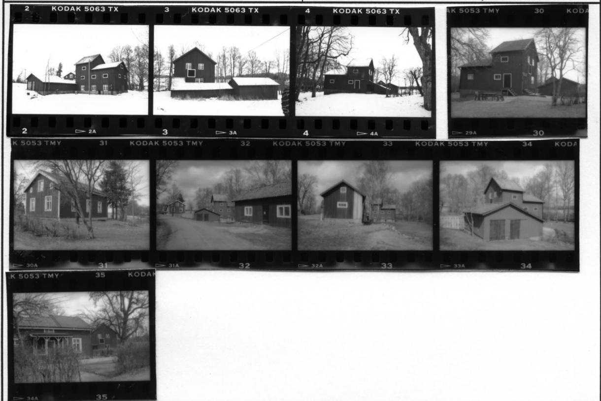
Foto Nr: VLM B 103.460 2-4, B 103.397 30-35