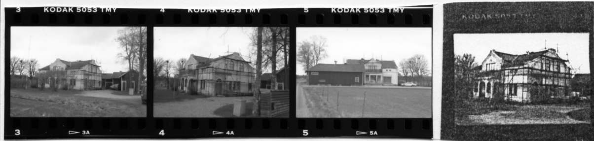
Foto Nr: VLM B 103.399 3-5, B 103.409 33