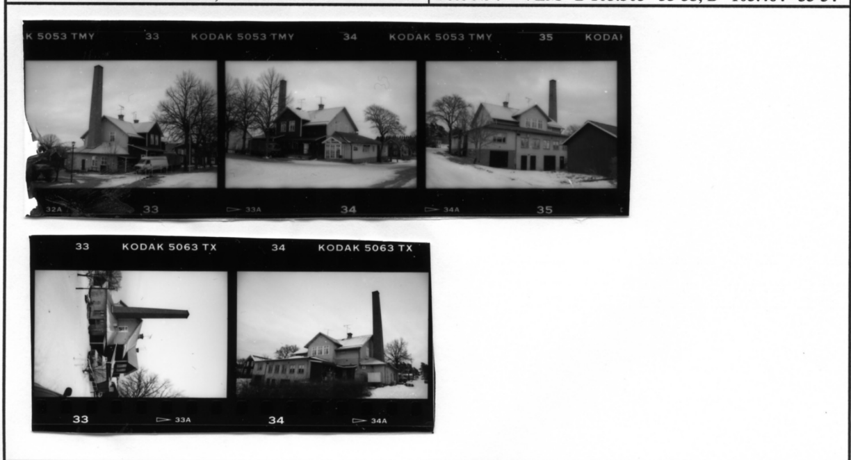
Foto Nr: VLM B 103.303 33-35, B 103.464 33-34