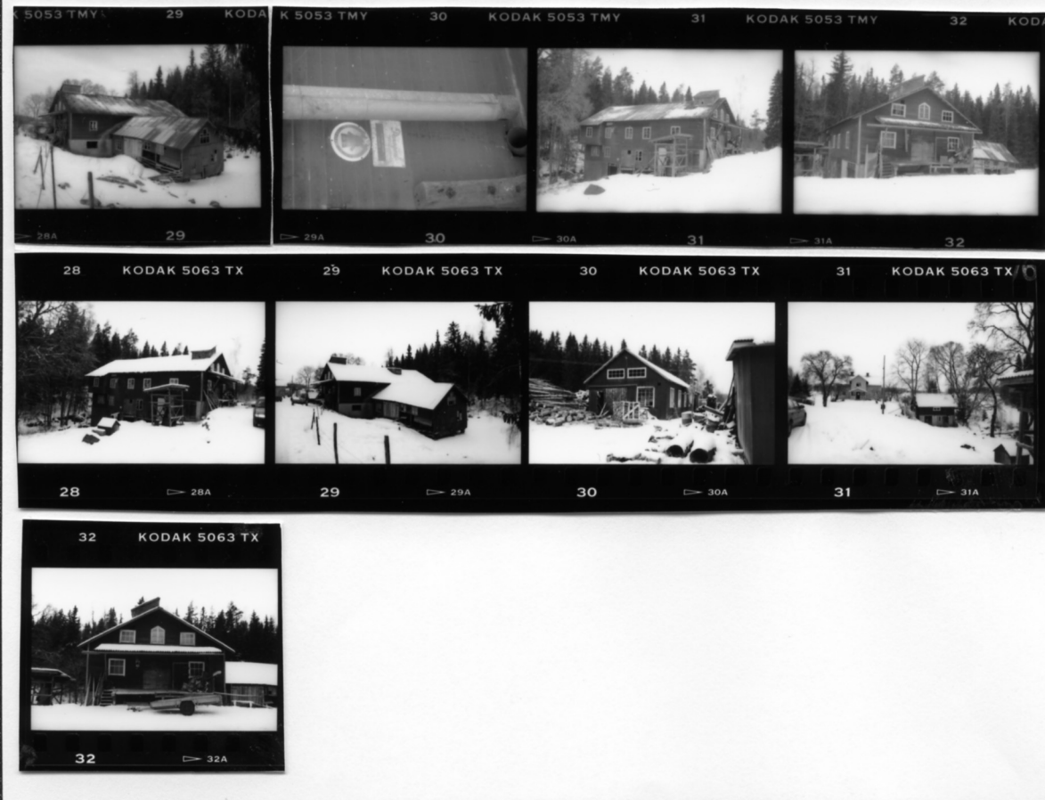
Foto Nr : VLM B 103.303 29-32, B 103.464 28-32