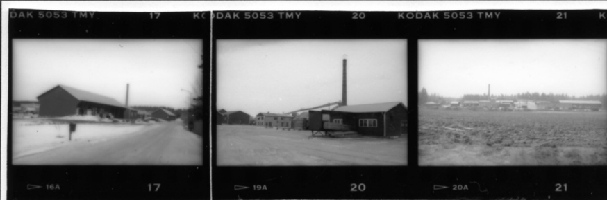
Foto Nr: VLM B 103.304 17, 20-21