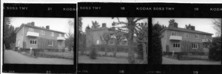
Foto Nr: VLM B 103.397 21, 18-19