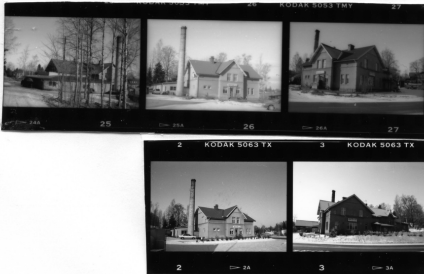
Foto Nr : VLM B 103.304 25-27, B 103.464 2-3