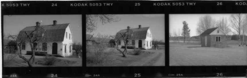
Foto Nr: VLM B 103.397 24-26