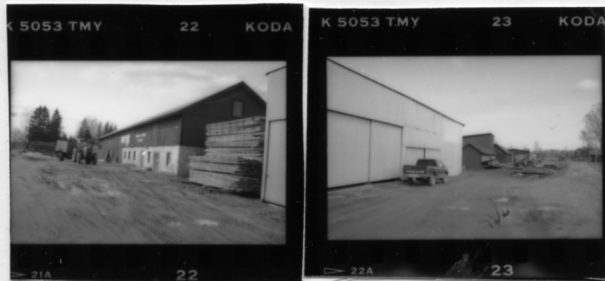
Foto Nr: VLM B 103.397 22-23