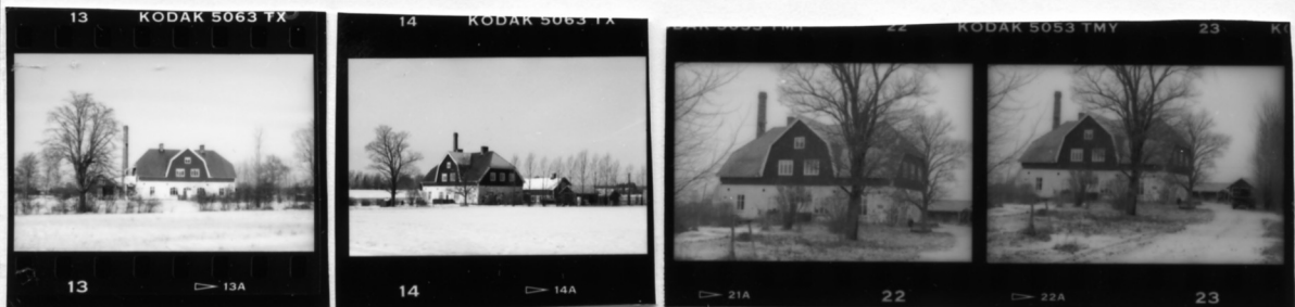
Foto Nr: VLM B 103464 13-14, B 103.304 22-23