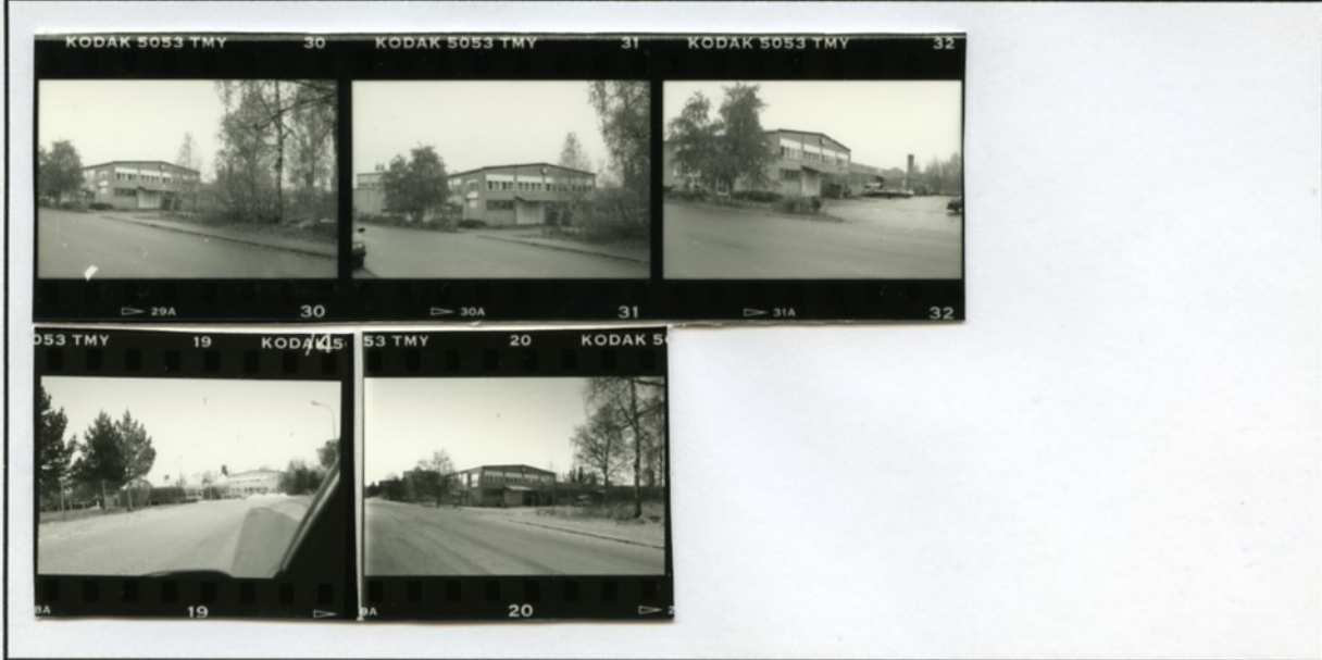
Foto Nr: VLM B 103.175 30-32, 103.359 19-20