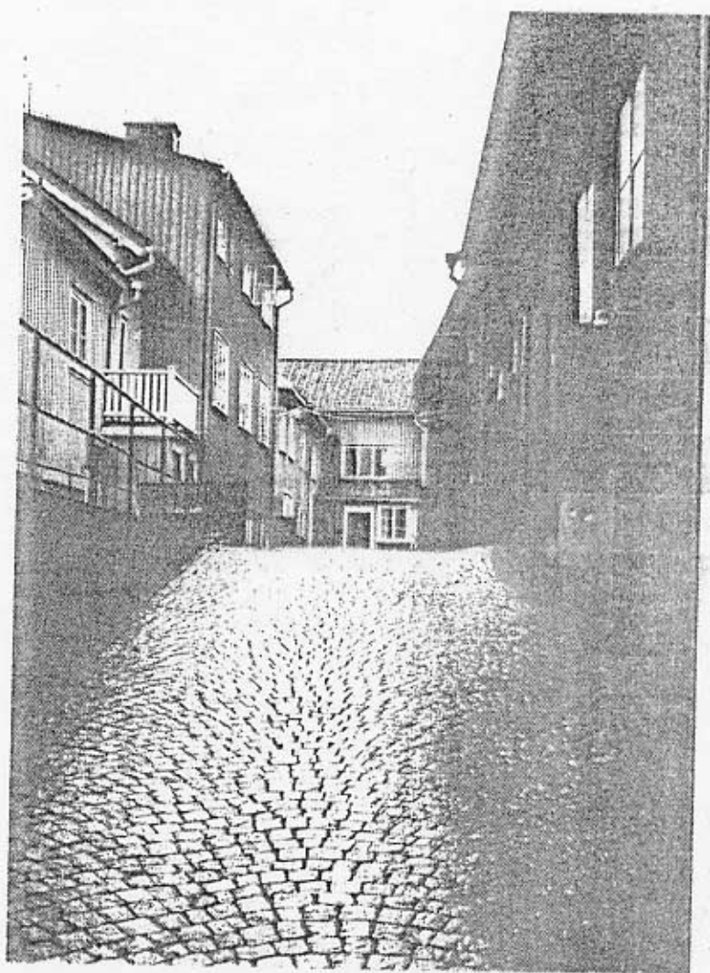
Stadens tidigare karaktär av en utpräglad handels- och hantverksstad finns dokumenterad, som nämnts, i gatubebyggelsen men också i den bevarade gårdsbebyggelsen.