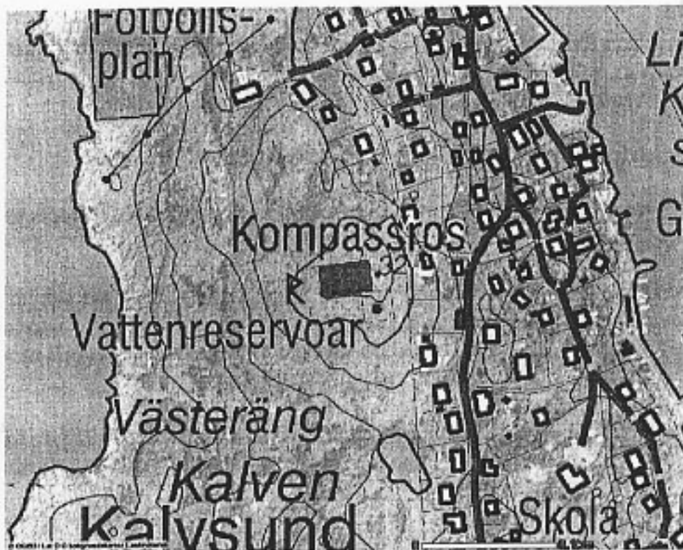
Figur 1. Byggnadsminnets skyddsområdes utbredning sammanfaller med fastigheten Kalven 1:3.

Stångmärket Valen var ett av de ca 200 fasta sjömärken utmed Sveriges kust som inventerades av Svenska firsällskapet i samarbete med Sjöfartsverket och Riksantikvarieämbetet under 2003. Projektet var en följd av den fyrinventering som genomfördes 1999. Syftet med inventeringen av kustens fasta sjömärken var att få en samlad bild av deras skick och utseende samt att identifiera de med särskilt kulturhistoriskt värde. Dokumentationen är tänkt att sammanställas i en databas.