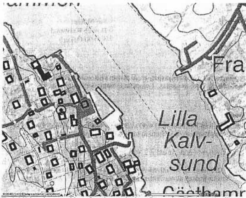
Fig 1. Mörkmarkerat område omfattar byggnadsminnet Bremerska villan/smugglarvillan

öns östra sida, Kalvsund, vilken också gränsar till farleden. I samhället Kalvsund har funnits sillsalterier, trankokerier, konservfabrik samt krog och gästgiveri.