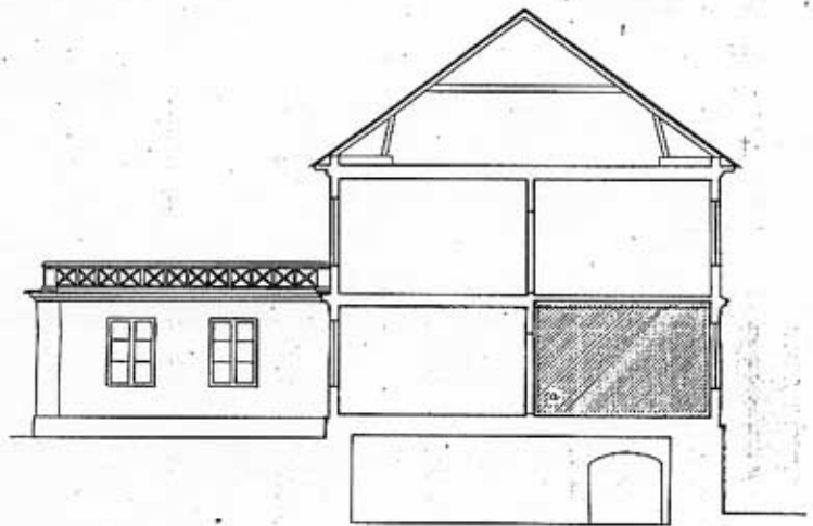
SECTION A - A

Upland Gringhundra hi St Tor en ERIKSUND