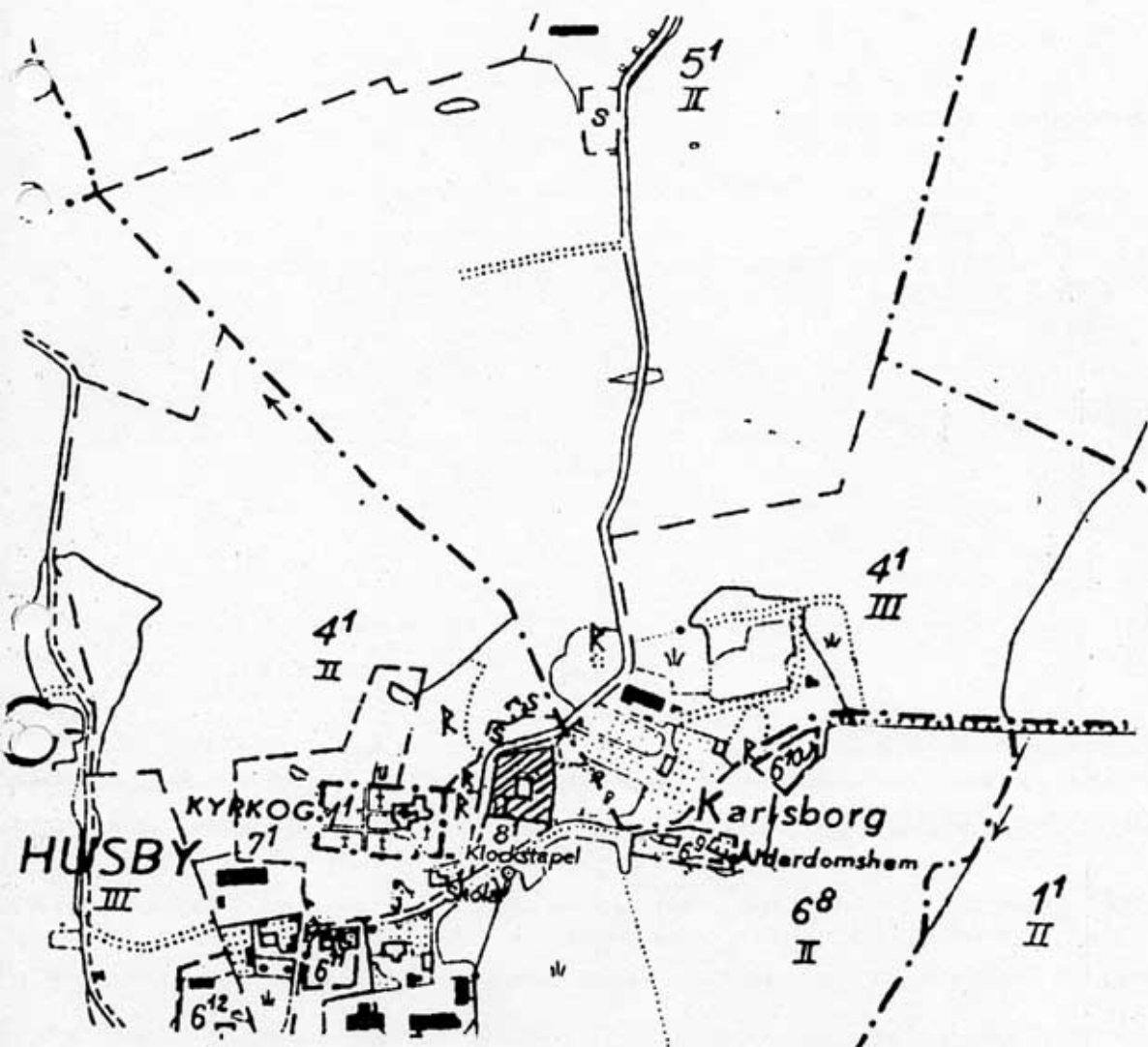
Utdrag och förstoring av ekonomiska kartan, skala 1:5000

- den skyddade fastigheten Husby 9:2, Sigtuna kommun (f d Klockarebord 1:2, Husby-Ärlinghundra socken)