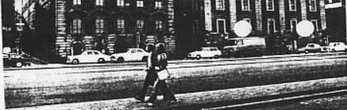
Södra bankhuset till vänster och Norra bankhuset. Fasaderna mot Skeppsbron