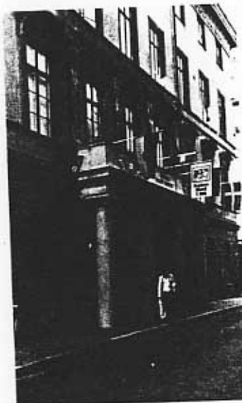
Posthusets fasad mot Lilla Nygatan