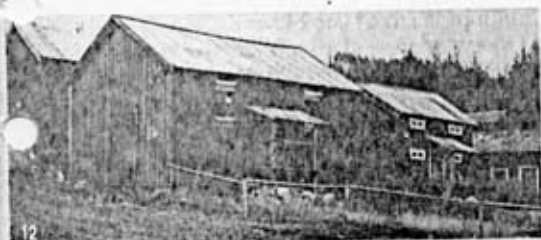
12. I Gastsjö finns timrade bodar med parvisa rektangulära ljusöppningar på ömse sidor ingången. Dessa bodar utgör ett bra exempel på en lokal byggnadstradition. Gastsjö 1:49, Hällesjö socken.