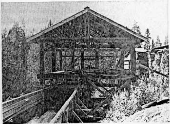
14. Inom kommunen har det funnits ett stort antal sågar. Denna ramsåg har drivits av vattenkraft och är uppförd ca 1870. År 1973 upprustades den genom AMS-medel. Sidsjö 3:30, Bodsjö socken.