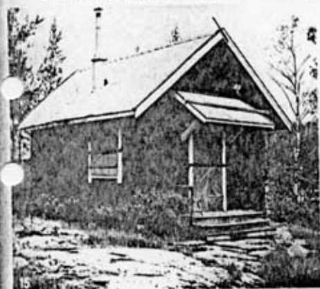
15. Bräcke kommun kännetecknas i hög grad av näringar inom skogsanläggningen. När flottningen upphörde revs de flesta anläggningar som hörde till denna verksamhet. Några flottningsstugor har emellertid bevarats genom att de fått en förnyad användning som t ex fritidshus. Rotseleforsen, (Småsjöarna 1:1) Hällesjö socken.