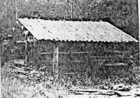
10. En inskription anger att ladan är byggd år 1665. Att döma av timringsteknik och utseende är denna uppgift trolig. Flatnor 2:6, Bodsjö socken.