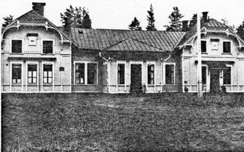
fasad mot NV