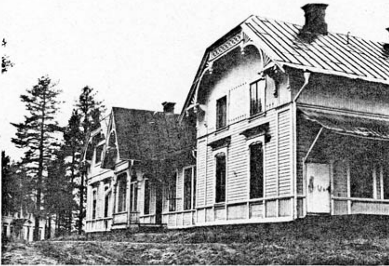
Marketenteri (4) fasad mot SO