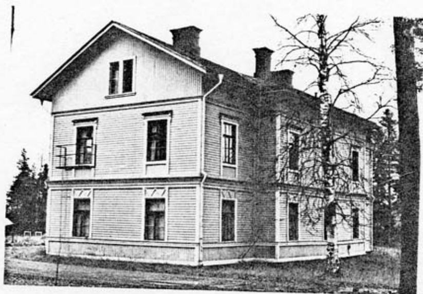
Officersbyggnad (3) fasad mot SV