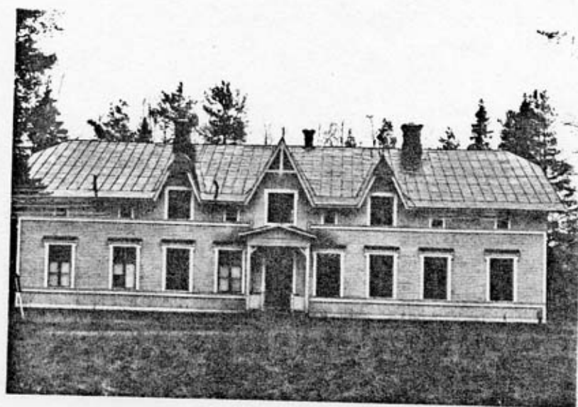
Underofficers- byggnad (5) fasad mot N