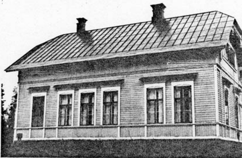
fasad mot SV