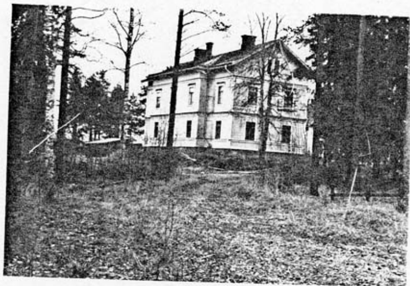
Officersbyggnad (2) fasad mot NO