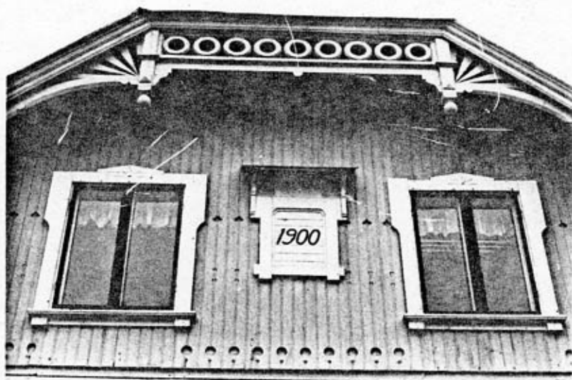
Marketenteri (4) detalj mot NV