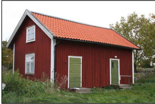
Visthusboden som nu fungerar som sommarbostad