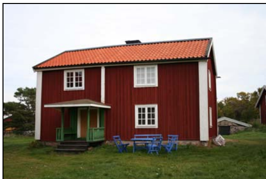
Farfarsstugan från 1700-talet

Farfarsstugan användes försiktigt som uthyrningsbostad och företrädesvis av andra än barnfamiljer. Stugan kan sägas vara under viss uppsnygning i långsam takt och beroende på vad respektive gårdsintendent orkar och hinner administrera. För denna stuga har ambitionen varit att behålla den så som den var på farfars tid.