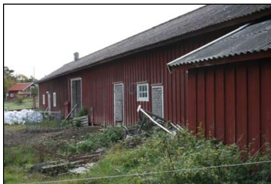
Gamla ladugården mot den nya anläggningen