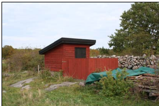
Den nya svinstian