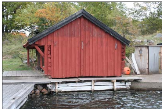
Gamla sjöbodens gavel