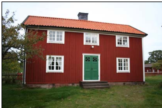
Nystugan från 1920-talet