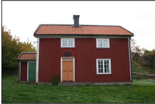
Lillstugan från 1850-talet