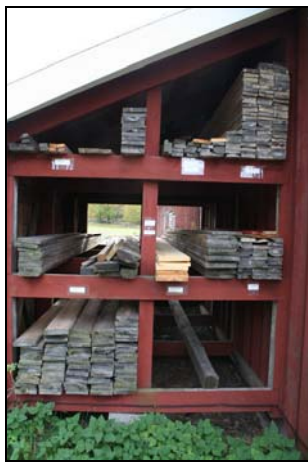
Noggrant förtecknat virkesupplag

Fastigheten Gräsmarö 1:2 besitter mycket höga kulturhistoriska värden och är värd att bevara i sin helhet och utgör en del av riksintresset Gryts skärgård [E77-82]. Riksintresset innebär en större sammanhängande kust- och skärgårdsmiljö med tydligt avläsbar särpräglad skärgårdskultur. Det finns exempelvis lämningar efter bebyggelse och hamnanläggningar från 1200-talet, lämningar efter säsongsfiskeläge, tullstation och tullhus från 1700-talet, fyr- och lotsplats från 1800-talet, Kättilö lotsby mycket välbevarad by med samlad bykärna, Harstena fiskeläge med oskiftad by-bebyggelse, Fångö gruva där koppar bröts under 1800-talet, Dala rösemiljö samt skärgårdsbyar med välbevarad 1800-talsbebyggelse bl a Gräsmarö.