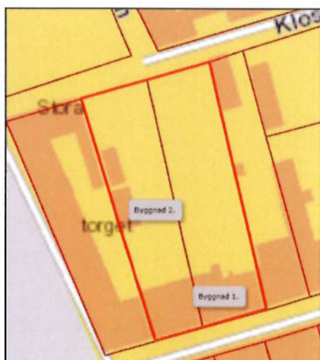
Byggnader som ingår i skyddsområdet