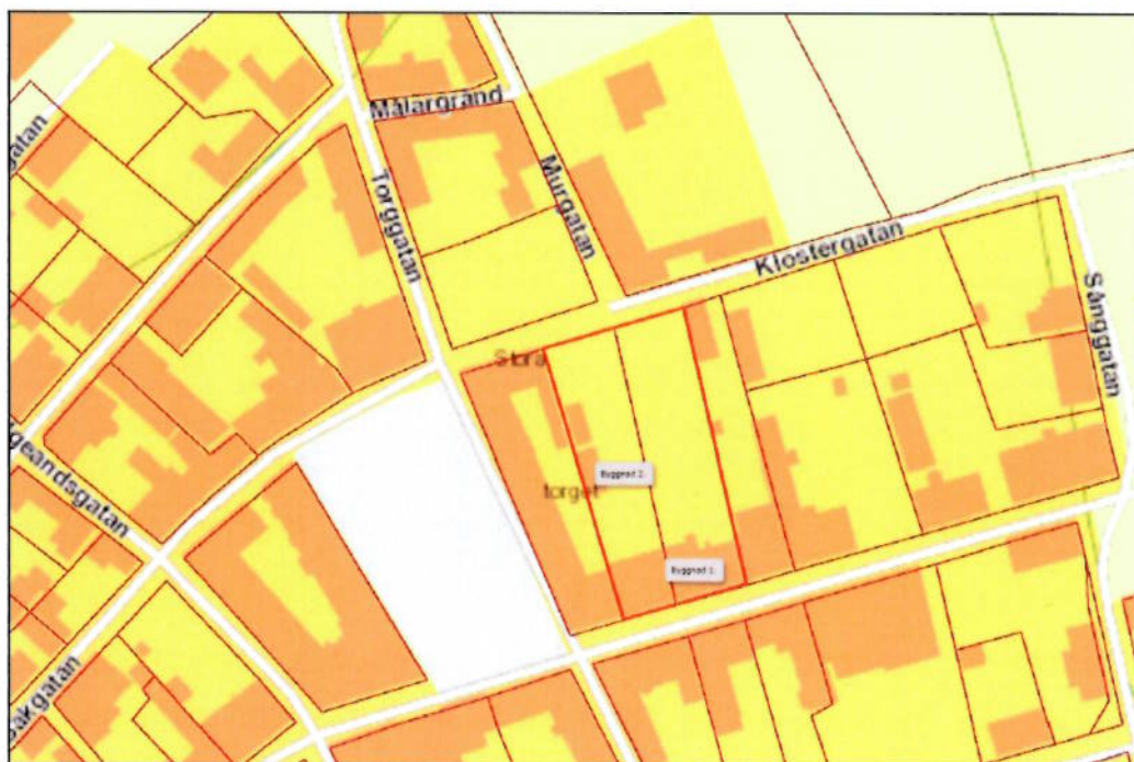
Karta med markerat skyddsområde – röd linje