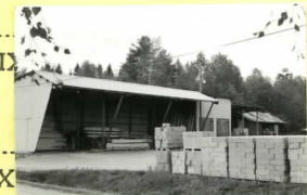
I o II Syd 25