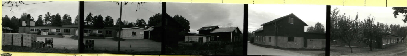
II o III Sydöst 26 III o IV Väst 27 IV o V Sydöst 28 V Nordost 29 VI Sydost 30