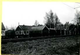
I II II 4