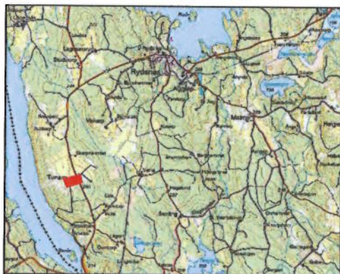
Översiktskarta 1: 54200.