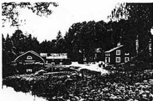
Kvarnanläggningen från norr

Växbo kvarn är en av två större kvarnanläggningar som under senare delen av 1800-talet byggdes vid Växboån. Vid denna tid ersattes de äldre skvaltkvarnarna allmänt av större kvarnar, vilket möjliggjorde en rationellare och mer koncentrerad drift. Den ena av dessa båda storkvarnar är idag rivna, medan Växbo kvarn bevarats i mycket gott skick.