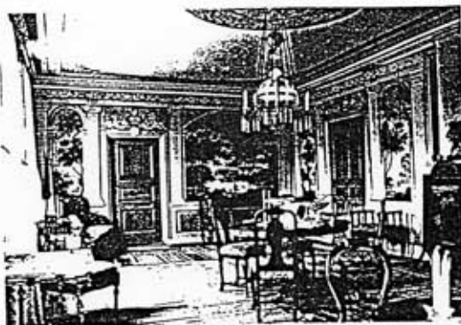
Storsalen med väggdekor av Jonas Wallström ca 1850 Foto: Länsmuseet i Gävleborgs län 1983

Gårdens ekonomibyggnader revs under 1960-talet, flertalet i samband med byggandet av den nya riksvägen Bollnäs-Söderhamn år 1960. Sedan 1967 ägs gårdsanläggningen med närmast omgivande mark av Bollnäs hembygdsförening, medan skogs- och odlingsmarken befinner sig i annan ägo.