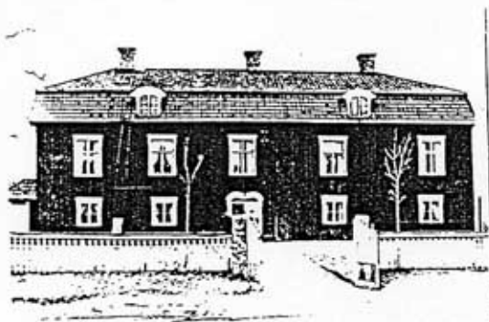
Mångårdsbyggnaden 1962

Renshammar var i äldre tid en av Hälsinglands största jordbruksgårdar. Under 1600-talet omfattade ägorna nästan hela norra delen av Bollnäs socken och gården åtnjöt för en tid även skattefrihet som säteri. Ägarlängden, som sträcker sig tillbaka till 1500-talet, visar att Renshammar genom tiderna i stor utsträckning bebotts av ståndspersoner som officerare, lägnän etc, men även bönder förekommer bland ägarne. Den nuvarande gårdsanläggningen bär dock i sin helhet en ståndsnässig prägel.