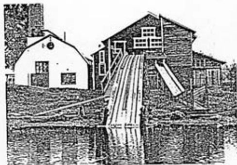
Nors ångsåg efter restaurering 1985