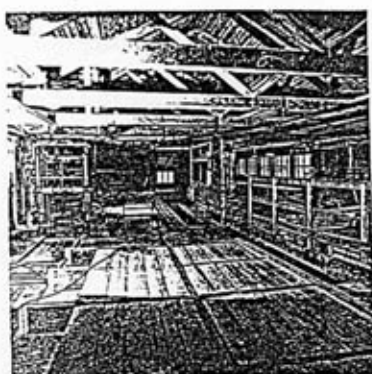
Interiör: Sågvinden