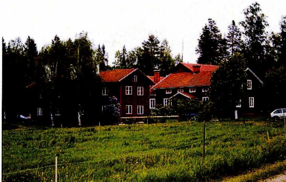
Från norr ser man tydligt hur den nya mangårdsbyggnaden från 1887 (till höger i bilden) underordnar sig Gammelbyggningen i storlek och form.

Under senare hälften av 1800-talet och 1900-talet har en rad förändringar skett på gården, men den ålderdomliga strukturen med den trånga gårdsplanen, kringbyggd på tre sidor har hela tiden bibehållits.