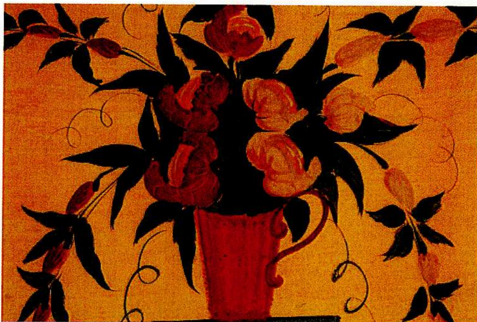
Karakteristiskt för ljusdalsmåleriet är de rika blomsterdekorationerna, schwungfullt utförda med lätt handlag och fina penslar.

pedestal med ett blomsterarrangemang. Övriga rum är schablondekorerade.