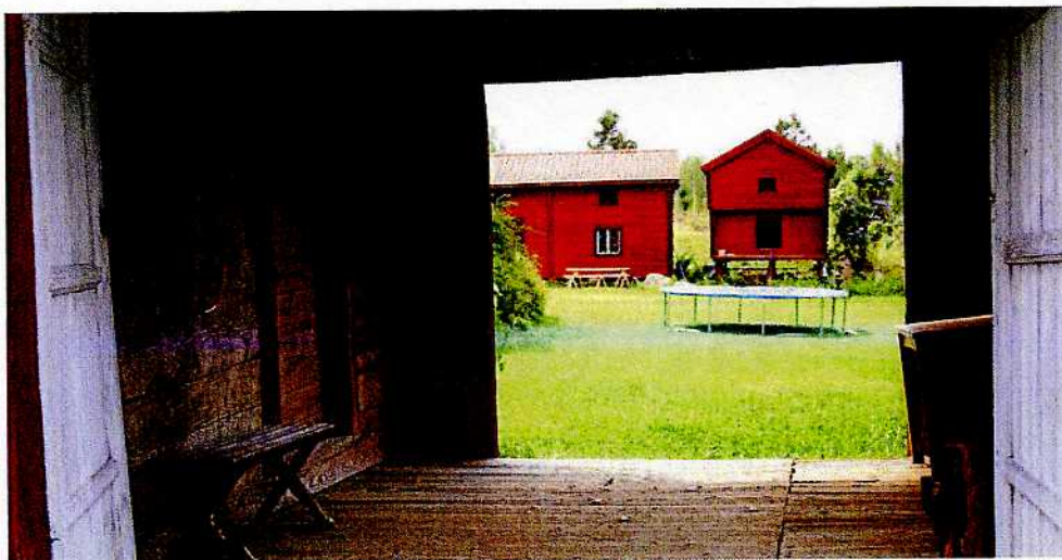
Från portlidret syns härbret och den utflyttade södra längan.

Gammelbyggningen och portlidret har bevarats i mer eller mindre oförändrat skick sedan 1800-talets första år. Från början var gårdsrummet helt slutet, med en fjärde länga i sydväst. Den har senare flyttats ut ett stycke från gårdsplanen, så att gårdsrummet har öppnats för eftermiddagssolen. Att de kringbyggda gårdarna på det här sättet bröts upp för att få in ljus och luft på gårdstunet blev vanligt under 1800-talet. Till gårdens ursprungliga byggnader hör också ett härbre, kanske byggt som ersättning för det som förstördes i branden 1804.