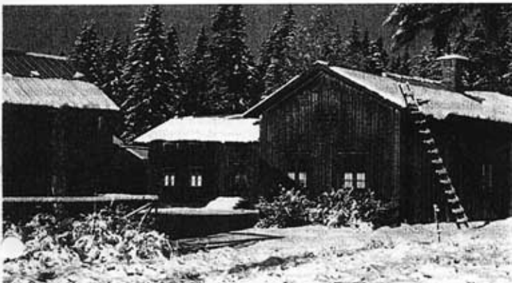
Ersk-Mats från sydost. Foto: Michael Ahne 1997.

Ersk-Matsgården i Lindsjön, Hassela socken, är ett representativt, men idag sällsynt exempel på en ensamgård i skogen vid 1800-talets mitt. Gården har nämligen inte genomgått några större förändringar sedan denna tid och är utomordentligt välbevarad. En dendrokronologisk datering har visat att Ersk-Mats äldsta delar härrör från 1770-talets slut, dvs från tiden när gårdens anlades, men att merparten av byggnaderna är uppförda i etapper under 1800-talets första hälft.