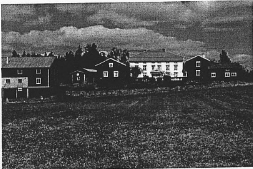
Pallars från söder. Från vänster ser vi: ladugården, bodlängan, bryggstugan, mangårdsbyggnaden och sängstugan/östra flygeln.

Pallars, Långhed 12:5, Alfta socken, Ovanåkers kommun.