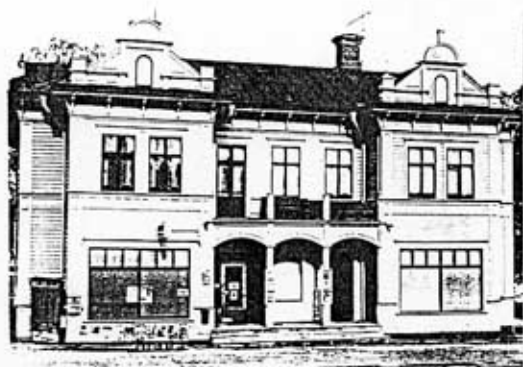
Gamla pappershandeln 1916