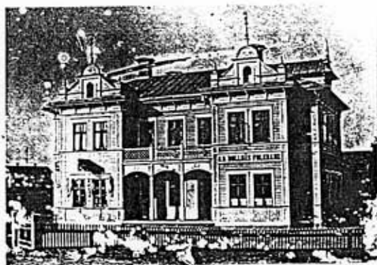
Gamla pappershandeln vid 1900-talets början

Gamla pappershandeln är ett av de många större trähus som ritades av byggmästaren Olof Johansson i Edsbyn under årtiondena omkring sekelskiftet 1900.