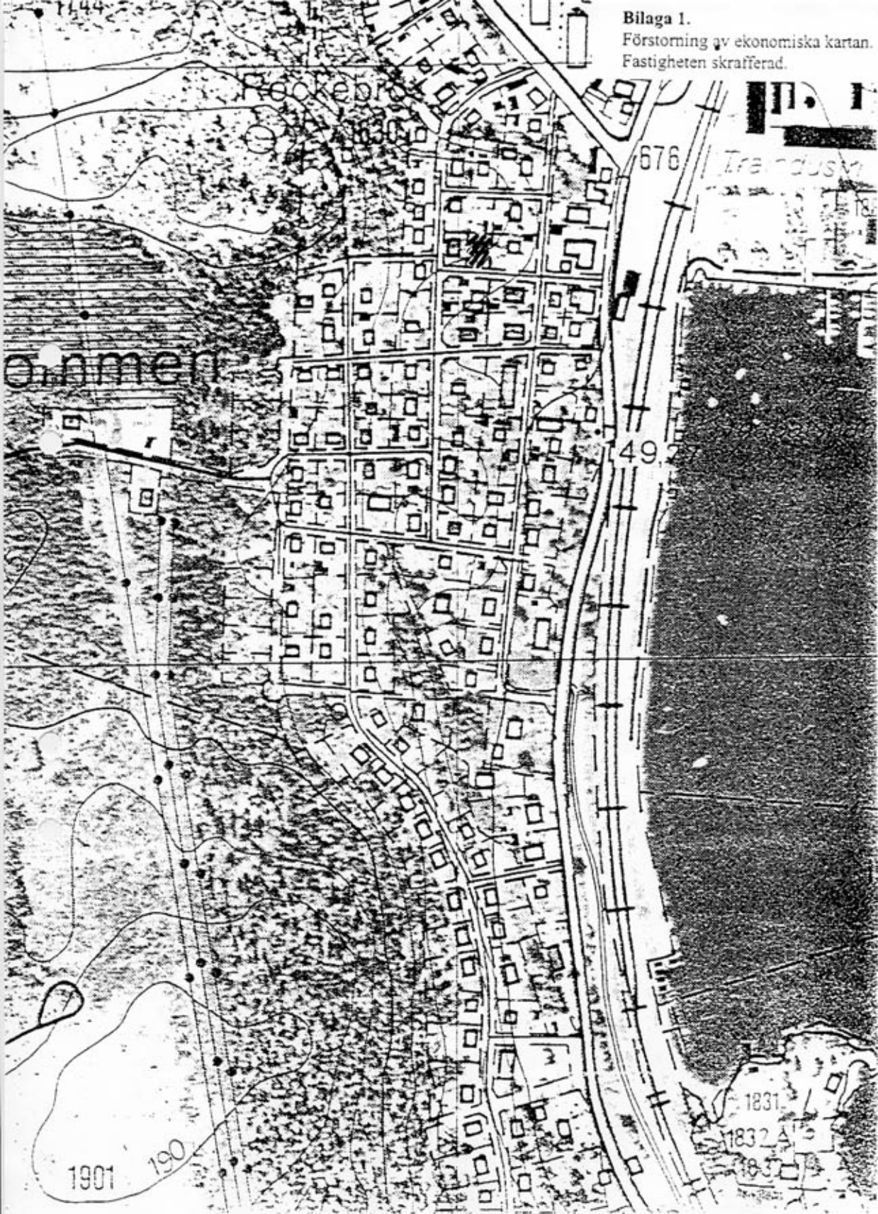
Bilaga 1. Förstoring av ekonomiska kartan. Fastigheten skrafferad.