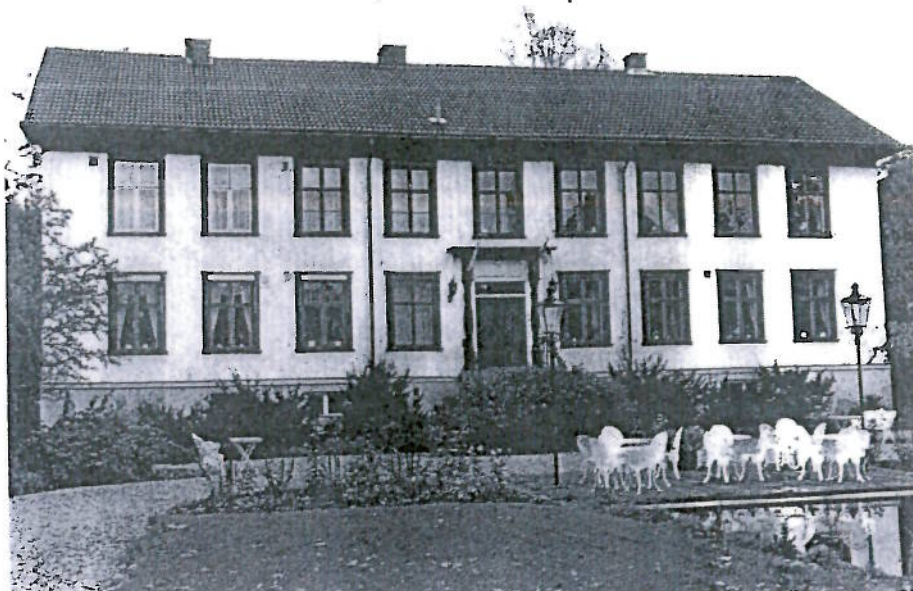
Disponentbostaden från väster

Huset, i två våningar uppfördes samtidigt med fabriken och var avsedd som disponentens bostad. Till denna fanns tidigare två flygelbyggnader. Det nuvarande värdshusets klassicerande fasader är täckta av vitmålade locklistpaneler med snickerier i brunt. Taket täcks av betongpannor.