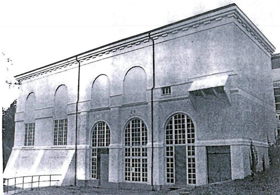
Kraftverket från sydväst

År 1916 var det nuvarande kraftverket färdigt. Fabriken hade från starten haft ett engelsk-tillverkat vattenhjul, placerat i fabriken för att driva spinnmaskinerna. Detta ersattes så småningom av turbiner. Kraftverket, som placerades vid ett nyanlagt vattenintag har spritputsade fasader och stora fönsteröppningar samt ett flackt tak. Stilmässigt går stationen tillbaka till samtida amerikanska anläggningar och är utformad i tjugotalsklassicistisk stil.