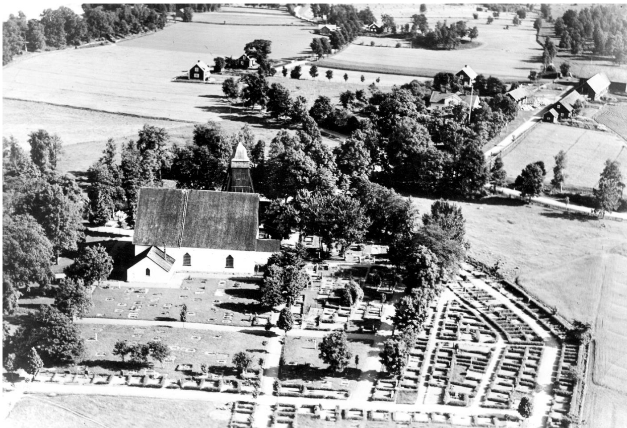
Flygbild över Norra Sandsjö kyrka 1942.

Kyrkomiljön i Norra Sandsjö ingår i ett område av riksintresse för kulturmiljövården, bestående av kyrkomiljön, herrgårdslandskapet och fornlämningsmiljön.