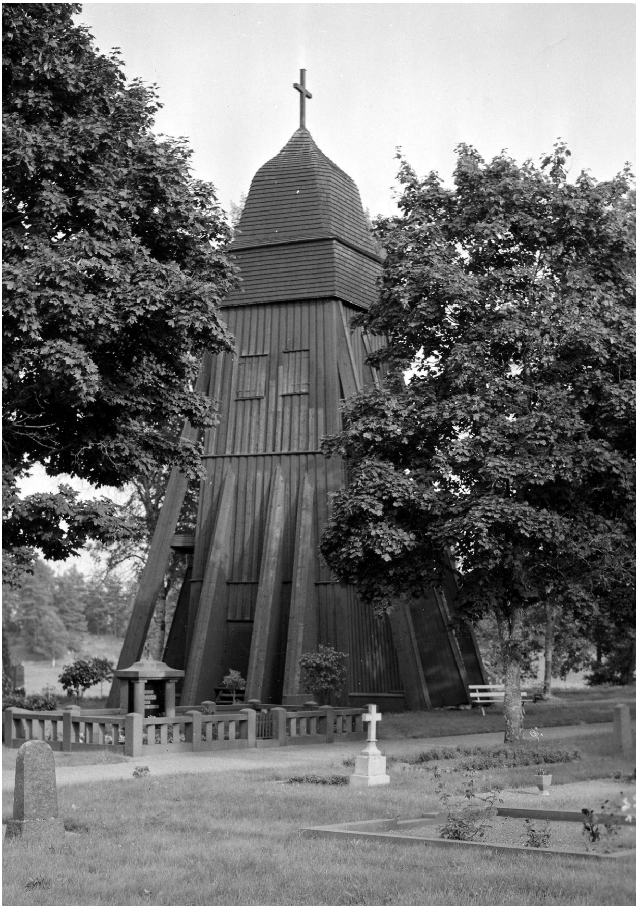
Klockstapeln vid 1900-talets mitt.