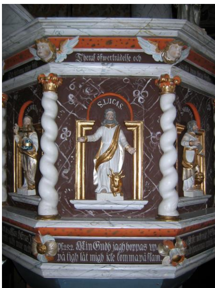
Detalj av predikstolens korg med evangelisten Marcus.