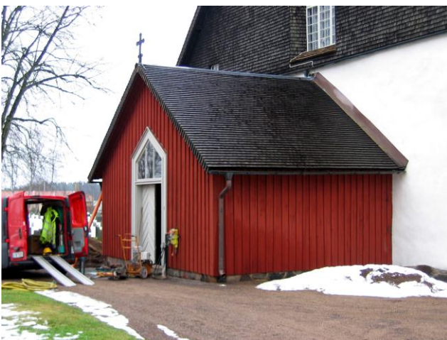
Vapenhuset från 1969.

Kyrkobyggnadens tak är av sadeltakstyp. Taken är belagda med spån som strukits med trätjära. Yttertaken avvattnas med hänggrännor och stuprör av kopparplåt. Samtliga gavelspetsar är försedd med smidda kors som målats svarta. Byggnaden vilar på en ställvis utkragad sockel av urbergsbergart. Denna sockel har åtminstone delvis varit putsad i äldre tid.