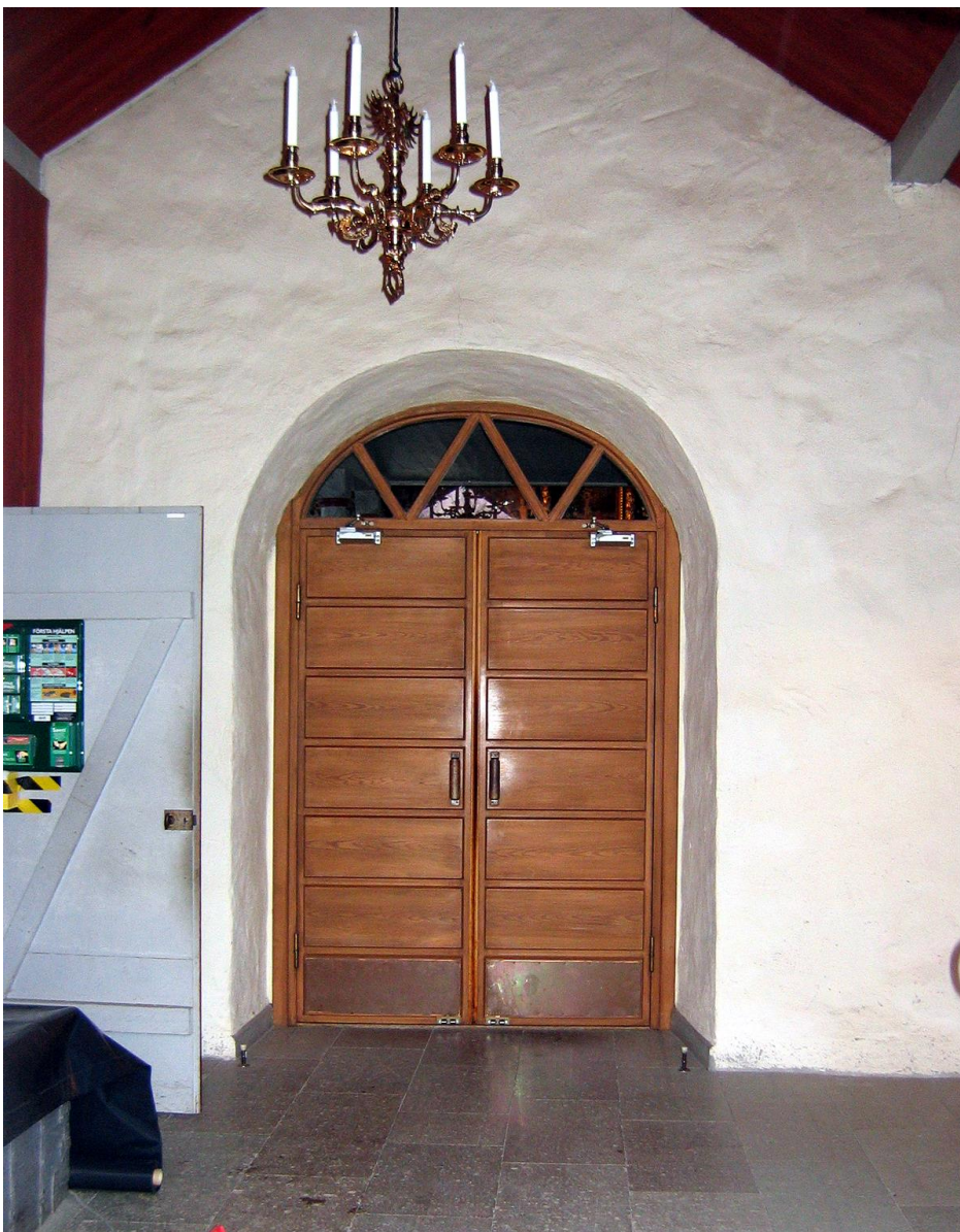
Interiör av vapenhuset.

Vapenhuset har ett golv av kalkstensplattor lagda med förskjutning. Mot söder och väster utgörs väggarna av det synliga timret. Mot öster ses kyrkobyggnadens stenvägg och mot norr finns en inbyggnad av stående brädor inrymmande två mindre skrubbar. Det ena byggdes vid inventeringstillfället om till toalett. Taket går upp i nock och består av brädor. Möbleringen utgörs främst av en äldre kista.