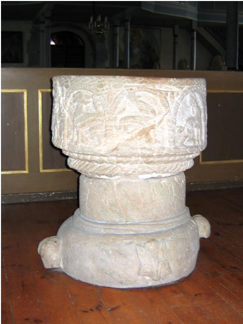
Dopfunten med djuornamentik på kuppan.

I koret står en tidigmedeltida dopfunten av sandsten. På kuppan förekommer djuornamentik och på foten finns utskjutande djurhuvuden.