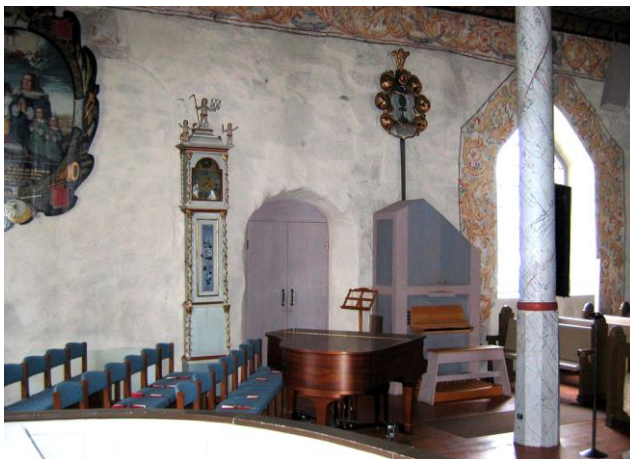
Södra delen av koret.

Vid den lilla sydingången står en sentida kororgel. Formen är enkel och den är laserad i rödgrå och blå kulör. På andra sidan om sydingången står ett ståndur med rak form målat i ljusgrönt och guld. I hörnen finns vridna kolonner och överst finns snidade putti. Fordralet är märkt "1764", "Carl Jakobsson" och "Martin Solberg". Enligt arkivuppgifter skänktes detta ur till kyrkan av rusthållaren Carl Jakobsson 1762. I samma hörn finns en piscina i form av en nisch i stenväggen. På väggen hänger ett epitafium över ätten Printzensköld, enligt uppgift möjligen målat av konstnären Johan Werner d y. På golvet står en manshög golvlysstake av mässing med fem armar från 1760. Kyrkorummet värms upp med bänkvärmare och väggradiatorer. Rummet lysas upp bland annat av sju ljuskronor av mässing. Dessa är av olika ålder och med olika utförande.