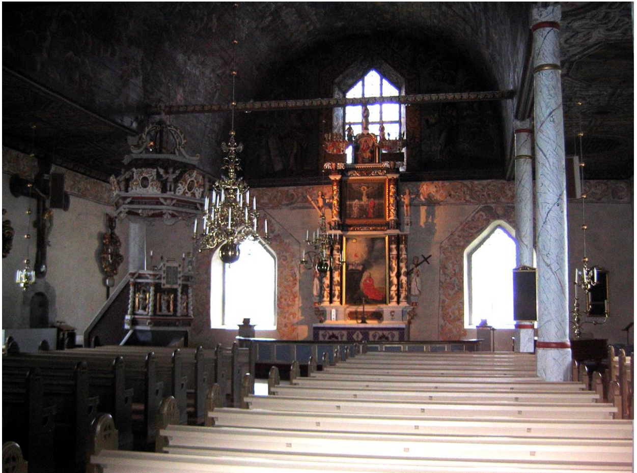
Kyrkorummet med altarupsatsen i öster.

Kyrkorummets innerväggar utgörs av bulig slätputs avfärgade i vitgrå kulör. Vid takfoten och runt flera fönster finns dekormålning med bland annat akantusslingor. Innertaket består av ett tunnvälvt mittparti och ett platt parti utefter varje långsida. Taket utgörs av breda brädor med omfattande dekorationsmålningar. Mittpartiets målningar är utförda i linoljefärg medan de platta partiernas målerier utförda i tempera. Mellan de två platta partierna löper två tvärbjälkar.