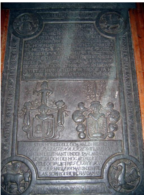
Gravhäll i mittgången.