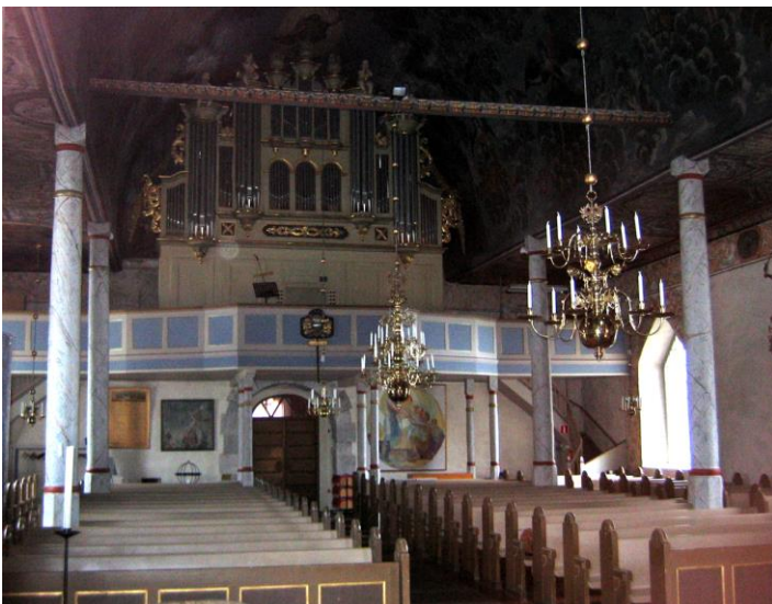
Läktaren med det storslagna orgelhuset av Lars Strömblad.

Längst i väster finns en orgelläktare som står på åtta gråmarmorade kolonner. Barriären utgörs av speglar med samma utformning och färgsättning som altarringen. Uppgången till läktaren sker via två trappor av trä. På läktaren står en orgel. Orgelfasaden är ovanligt storslagen med synliga pipor, skulpterade änglar m m. Orgelhuset är målat i grågrön kulör samt delvis förgyllt. Under läktaren står en styrpulpst och en ljusbärare.