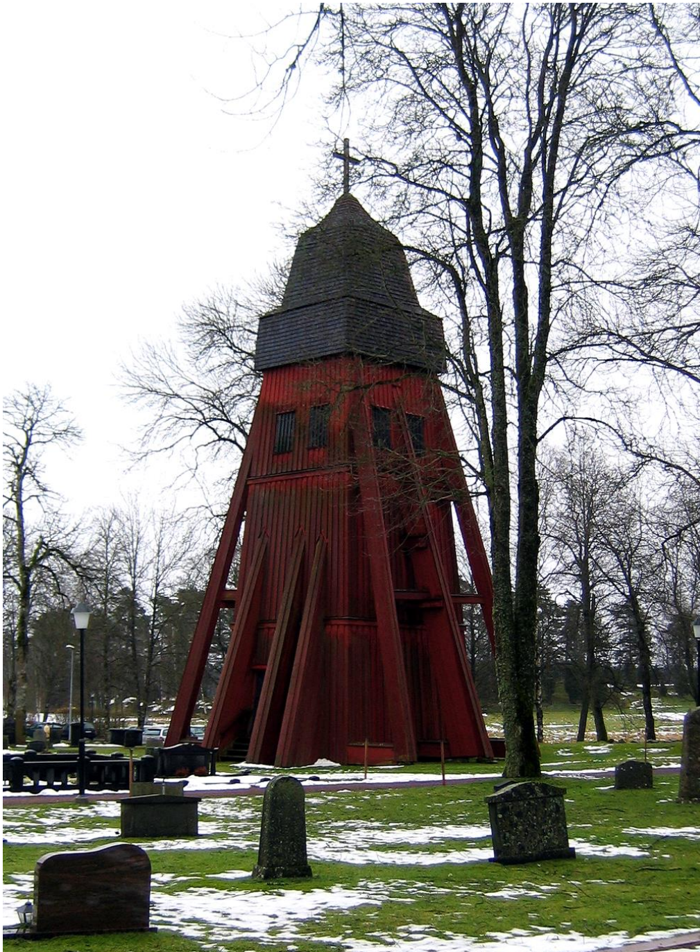
Klockstapeln sedd från nordost.

Inbyggnaden avslutas upptill med ett klockhus och en överbyggnad. Klockhuset och ljudluckorna är klädda med sk kyrkspån, som strukits med rödtjära. Huven är klädd med spån som strukits med trätjära. Överst kröns stapeln av ett svart kors.