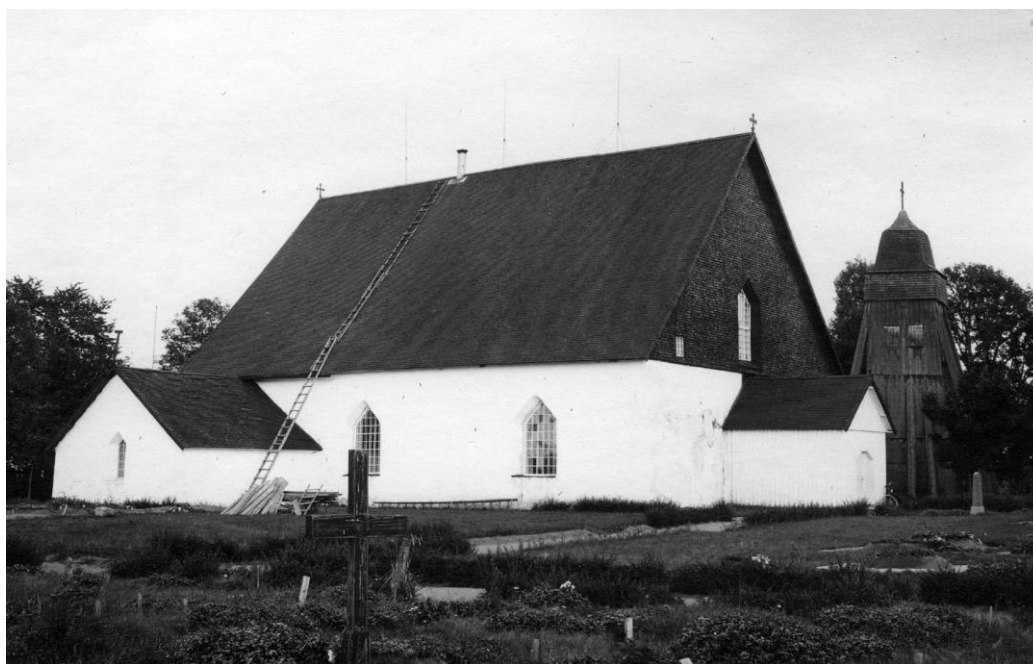
Tidigt fotografi av kyrkan från norr. Särskilt lägger man märke till den oordning som tycks råda på kyrkogården.