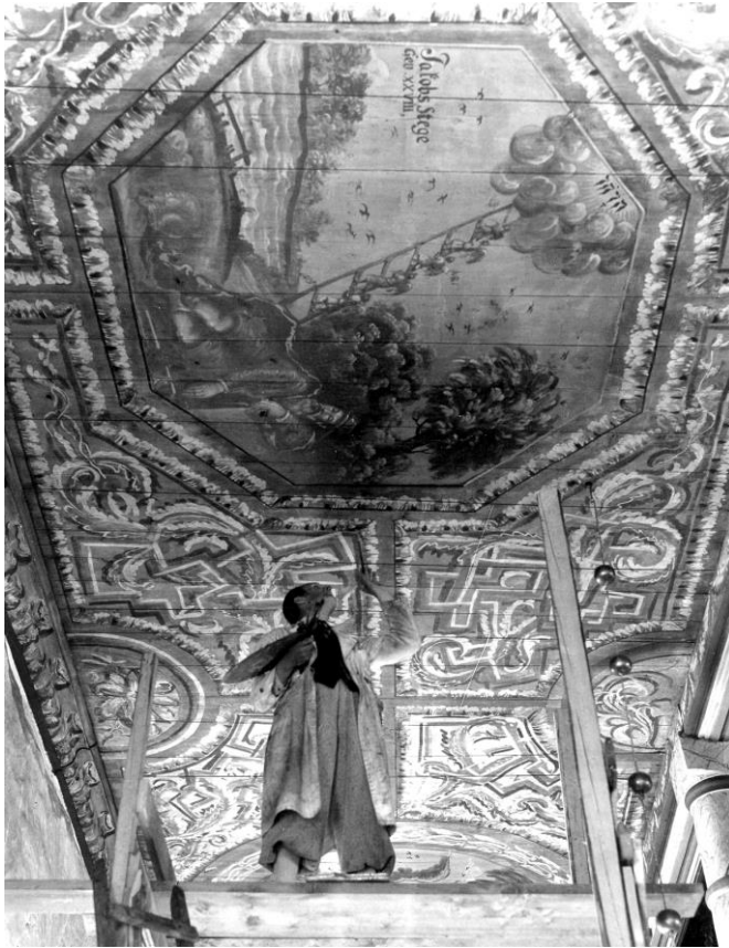
Konservator Sven Wahlgren konserverar innertaket 1942.

På 1950-talet genomfördes ytterligare förändringar och restaureringar. Ett nytt elektriskt system för uppvärmning och belysning installerades 1951 och 1957 ledde arkitekten Rolf Bergh omläggning av yttertaket med ekspån. Vidare togs exteriörens röda dekormålning fram.