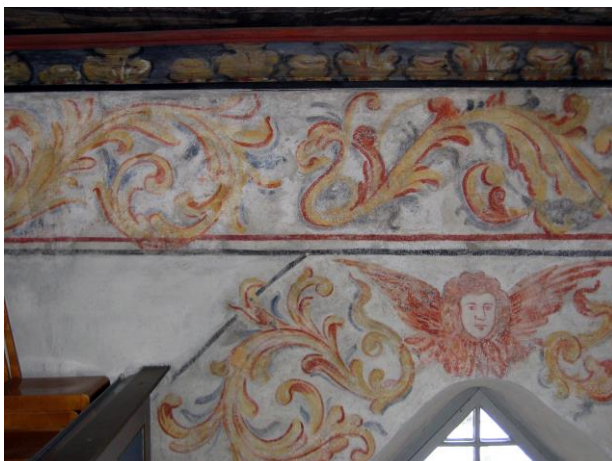
Detalj av väggmålningarna av Johan Columbus.