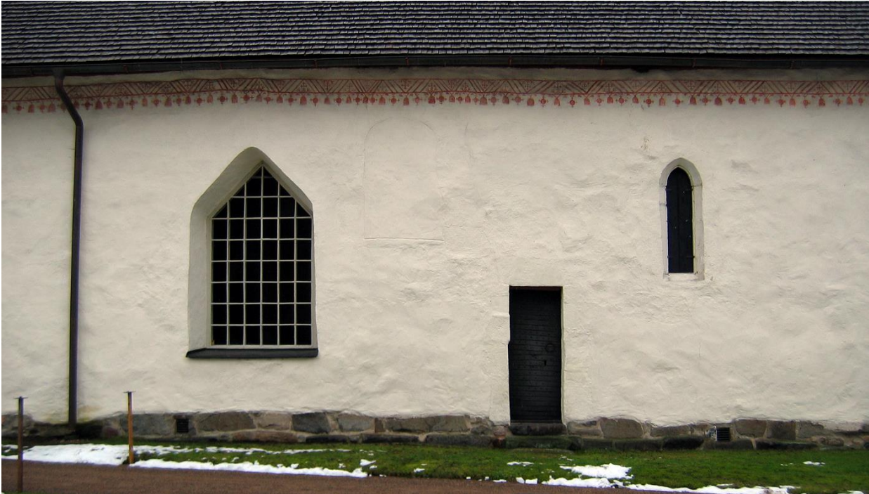
Parti av sydfasaden med röd dekormålning vid takfoten.

Flertalet fönster har spetsig övre avslutning. Dessa är av enluftstyp med tät spröjsning. På sydfasaden finns en medeltida lansettformad fönsteröppning som återupptogs 1957. Denna fönsteröppning är inte synlig invändigt och har en insatt svartmålad lucka av trä i stället för en fönsterbåge. Fönsterna är målade i vitgrå kulör. På sydfasaden finns – både ut- och invändigt – tunna ritsar som markerar var äldre fönsteröppningar tidigare funnits. Flertalet solbänkar är klädda med kopparplåt.