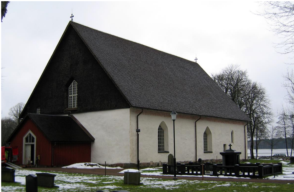
Kyrkobyggnaden sedd från sydväst med sjön i bakgrunden.

Kyrkobyggnaden, frånsett vapenhuset, är uppförd av skalmurad sten och har fasader av bulig slätputs som avfärgats i vitaktig kulör. Överst på långsidorna finns ett dekormönster i rött. Långhusets gavelrösten är klädda med spån som strukits med trätjära. Vapenhuset har en stomme av timmer och en fasad av stående locklistpanel. Denna har målats med falu rödfärg.