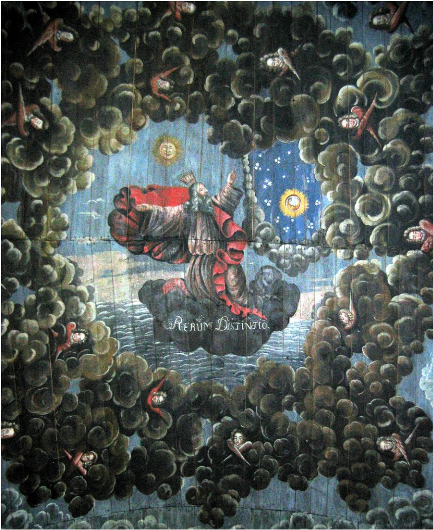
Parti av taket över koret föreställande Skaparen.