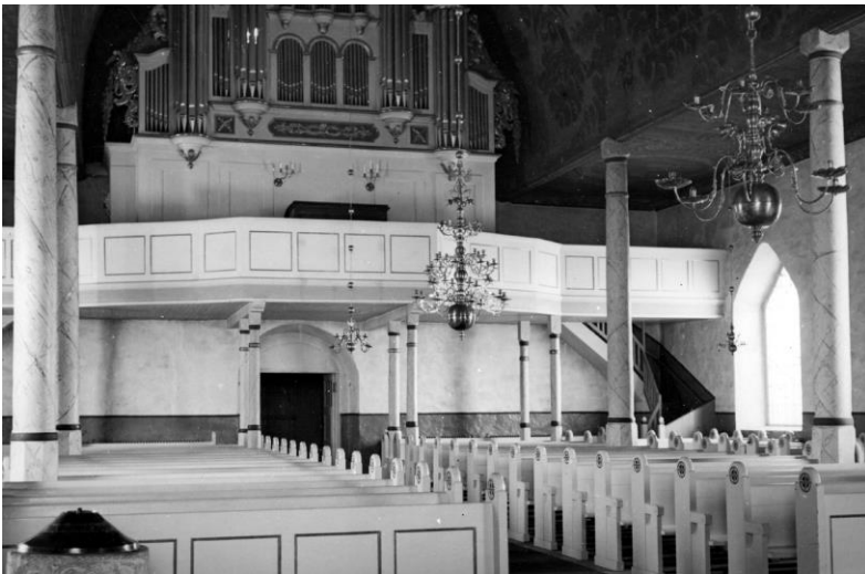
Vid 1910 års restaurering tillkom nya bänkar och en ny läktarbarriär, som målades i vitt.

År 1910 genomfördes en omfattande restaurering efter ett förslag av arkitekten vid Överintendentsämbetet Georg A Nilsson. Byggmästare var C och A Gustafsson från Medalby i Mellby socken. Den mest iögonfallande förändringen var den nya bänkinredning, som sattes in och målades i bruten vit kulör. En vit färgsättning på bänkar, altarring, läkrate och orgel kvarstod åtminstone till 1950-talet. Även altarringen och läktarbarriären byttes ut samtidigt som predikstolen flyttades. Snickerierna utfördes av Ängsfors snickerifabrik, Hovslätt. Måleriarbetena handhades av målaren C J Rohlander, Klevshult, varvid bland annat originalfärgen framtogs och rekonstruerades på predikstolen och altaruppsatsen. När denna restaurering genomfördes var man väl medveten om kyrkobyggnadens kulturhistoriska värde och detta värde tillvaratogs i allt väsentligt. Man bör emellertid vara medveten om att väggmålningarna vid denna tid inte var framtagna. Inte heller sydingången var upptagen då.