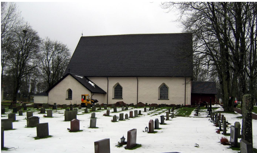
Kyrkobyggnadens norra fasad under pågående schaktning.