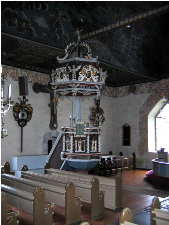
Predikstolen utförd av Gustaf Kihlman 1704.

Predikstolen är polygon och barriären utgörs av speglar med bland annat evangelisterna snidade i trä. Utöver detta förekommer vridna kolonner och änglar. Ljudtaket är likaledes polygont och försett med änglar, festonger m m. Predikstolskorgen vilar på en polygon pelare.