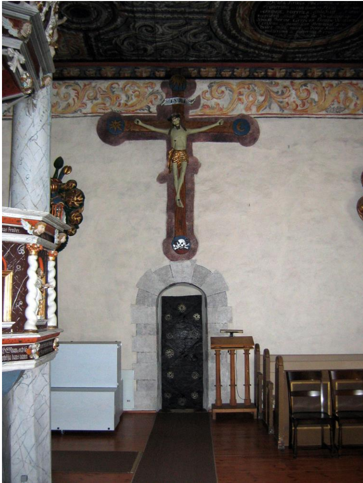
Ingången till sakristian med krucifixet däröver.