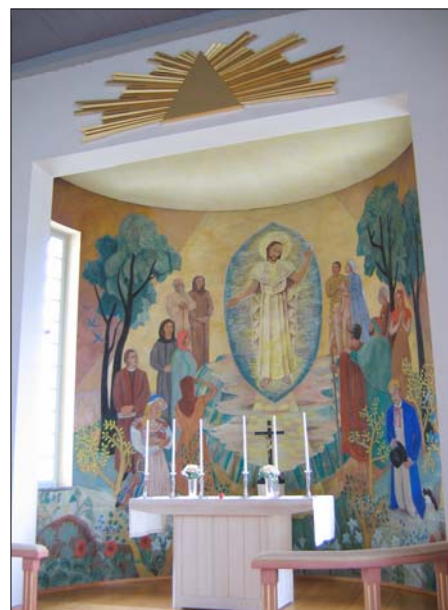
Absidmålningen utfördes i sin ursprungliga storlek 1941 i samband med kyrkans uppförande. Sedan dess har målningen utökats vid två tillfällen, alltid av samma konstnär.