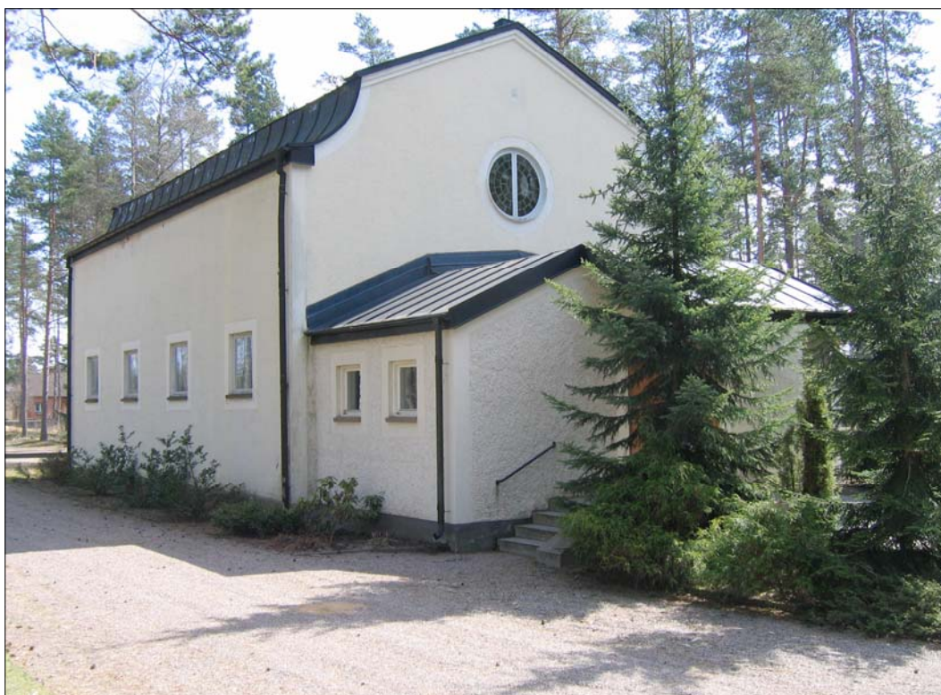
Kapellet byggdes till på 1990-talet varvid samlingsutrymmen skapades samt förbättrades tillgängligheten. I övrigt har mycket små förändringar skett sedan kapellet uppfördes 1941.

Interiören präglas av en stram enkelhet med ljusa odekorerade ytor. I den senare tillkomna utbyggnaden har samlingsrum och toalettutrymmen förlagts.