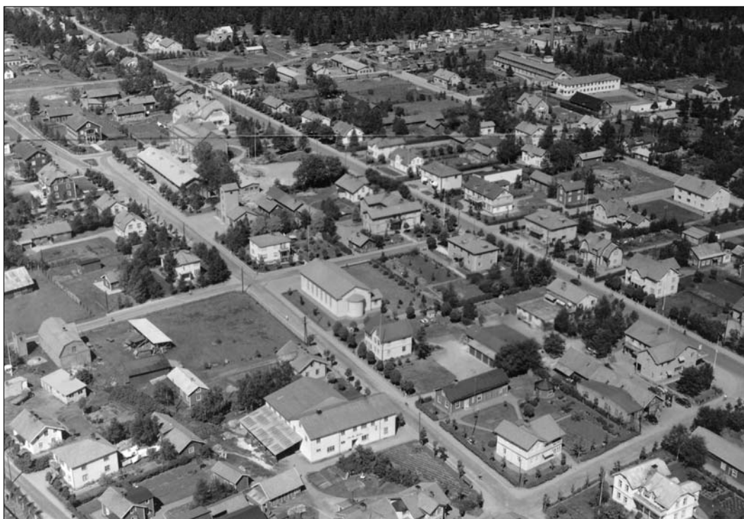
Ett flygfoto från början av 1950-talet visar hur kyrkan är belägen mitt i samhället. Kyrkogården är inte med på bilden men finns belägen strax utanför bildens övre vänstra hörn. Foto AB Flygfoto, 1952.

Redan den 9 oktober 1905 beslutade Tofteryds församling att en kyrkogård skulle anläggas i Skillingaryd. Det dröjde dock fram till 1921 innan kyrkogården invigdes. För utformningen av kyrkogården dess krucifix och kyrkogårdsmur stod arkitekten Karl Martin Westerberg från Stockholm. Allt sedan invigningen har kyrkogården utvidgats vid flera tillfällen: 1934, 1943, 1953 samt togs 1970 en ny del i bruk.