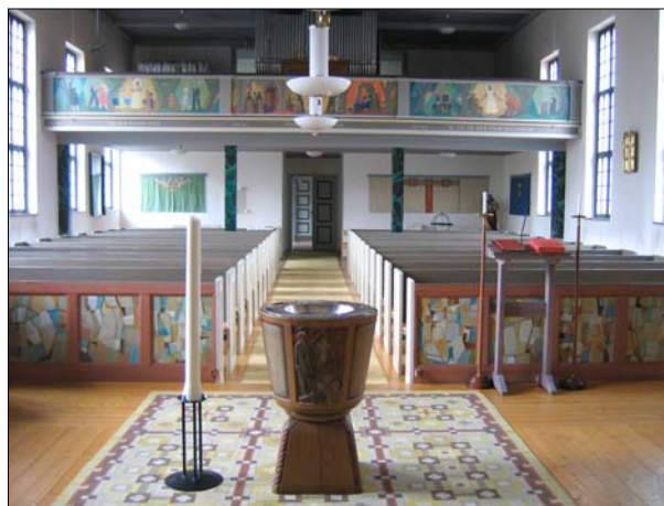
Bilderna visar kyrkorummet som det ser ut efter den senaste restaureringen. Arbetena som då genomfördes efter det att ett nytt församlingshem tillbyggs kyrkan och syftade till att förstärka rummets sakrala atmosfär