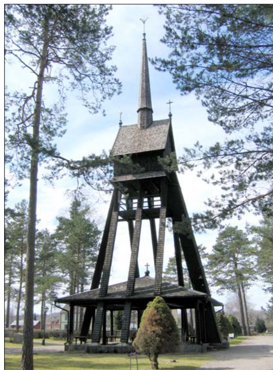
Klockstapeln var den första byggnaden som uppfördes på kyrkogården. Längre förrättades begravningsceremonierna under den täckta uteplatsen.

Det har inte genomförts några ombyggnader av klockstapeln utan de åtgärder som skett har varit av underhållsart. 1970 genomfördes en komplettering av spånbeklädnaden och 1973 installerades ett fjärrringningssystem vilket medförde att ingen längre behövde ta sig från kyrkan inne i samhället ut till klockstapeln för att genomföra ringningen. 1981 skedde en omtjärning av klockstapeln och samtidigt guldbronserades den krönande tuppen. 1990 utfördes en tillbyggnad vilket tillskapade samlingsrum, officiantutrymmen och toalett. Samtidigt gjordes en tillgänglighetsanpassning av kapellet. Tillbyggnaden har utformats så den harmonierar med den ursprungliga strukturen. Vidare installerades samtidigt fasadbelysning vid klockstapeln och kapellet.