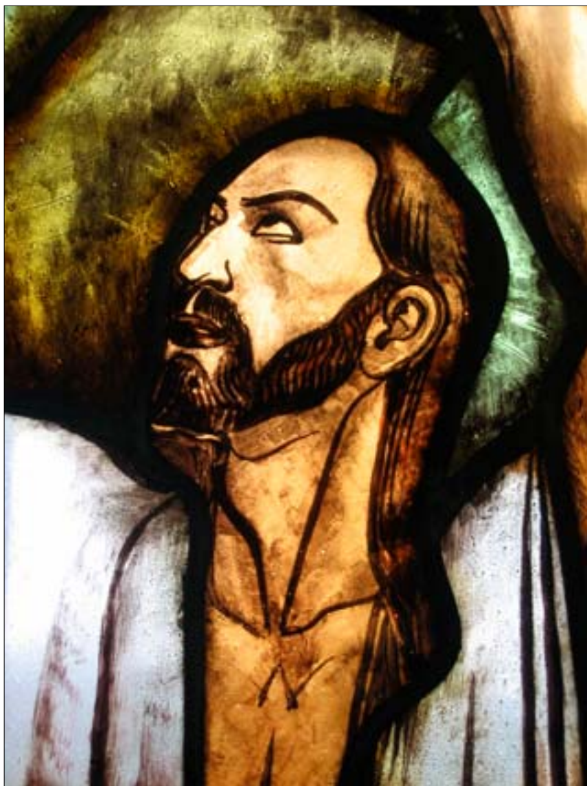
Detaljbild av en de glasmålningarna som sitter i koret.

Den senaste utvändiga restaureringen genomfördes 1983-85 varvid fasaderna putsades, sockelputsen togs bort i sin helhet och putsades med ett genomfärgat hydrauliskt kalkbruk. Fasaderna avfärgades med vit kalkfärg (på KEIM-silikat?). Vid samma restaurering lades ett nytt tegeltak. Kyrkans fönster renoverades och de utvändiga snickerierna ommålades med oljefärg.