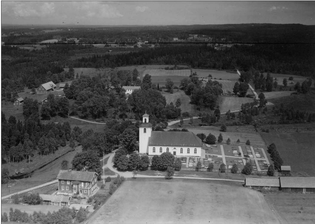
En flygbild från slutet av 1940-talet visar hur kyrkan ligger höjd över omgivningen. Bebyggelsen i bilden övre del är prästgården m.m. Foto AB Flygfoto, 1947. (JLM)

Kyrkan och den omgivande kyrkogården omgärdas av en kallmurad stenmur. Huvudentrén till kyrkotomten sker via den västra entrén, utöver denna finns ytterligare två entréer mot söder. Kyrkogården har utvidgats vid flera tillfällen.