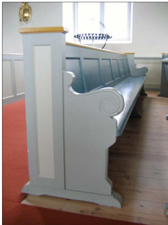
Bänkinredningen ersattes 1909 av denna öppna typ. 1978-79 gjordes en invändig restaurering då bänkarna fick den färgsättning de har idag.

ommålning där kyrkans väggar målades gråvita och taklisten, altaruppsatsen och läktarkolonnerna marmorades i grågrönt. Den nya bänkinredningen ådringsmålades och predikstolen och läktarfasaden målades vita med dekor i rött och guld, vid predikstolen utfördes draperimåleri. Orgelfasaden målades grågrön.