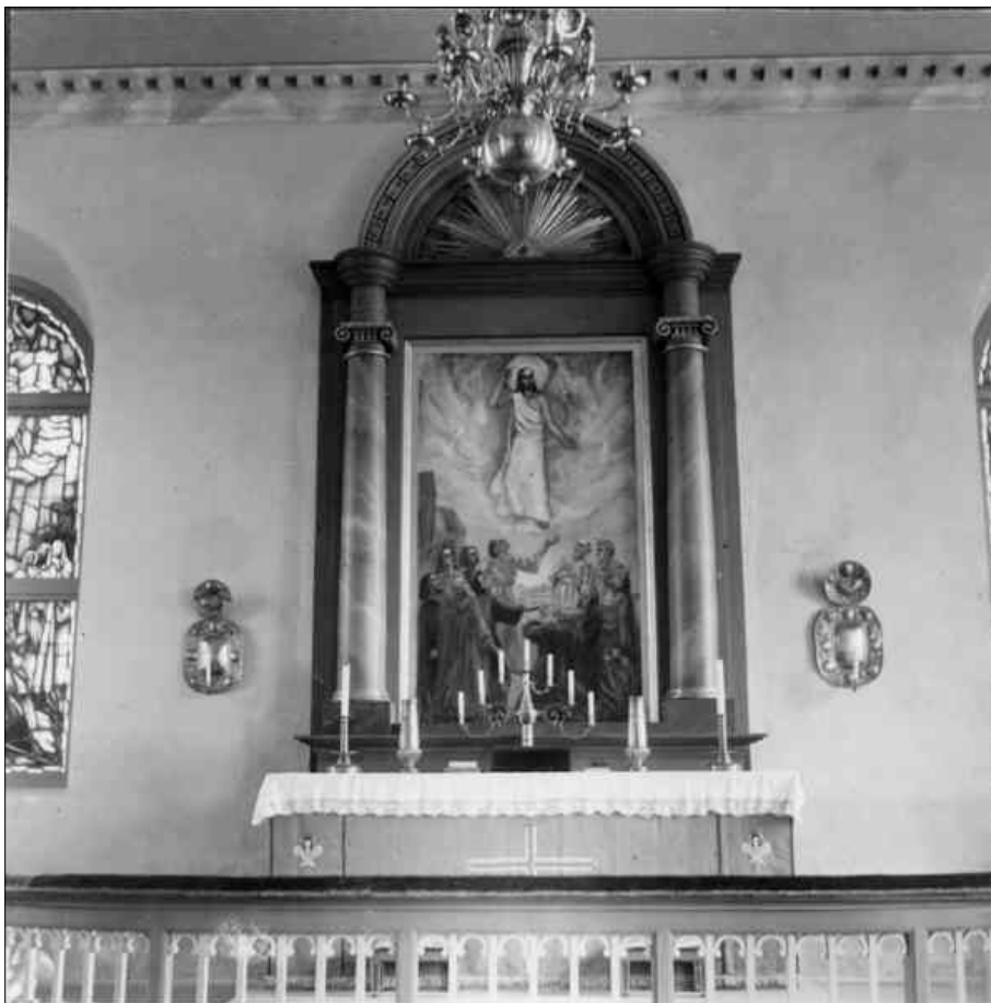
Foto av den altartavlan när den var ny. Fotot togs 1937 av Egil Lönnberg.

Specifika inventarier. Kyrkan fick en ny altartavla. Den nya altartavlan utfördes av konstnären Kåge Liefwendal och föreställer Kristi himmelfärd. (Cinthio, E. 1993)