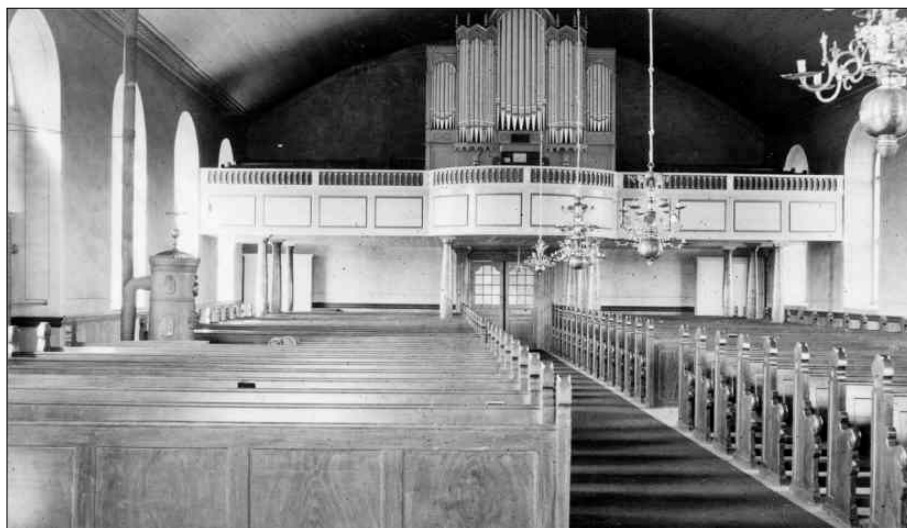
Interiörbild från 1934 inför den kommande restaureringen. I bakgrunden syns en av de järnkaminer som installerades 1895. Bänkinredningen byggdes om vid 1935-års restaurering och fick sin nuvarande färgsättning 1978-79.