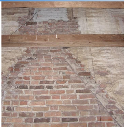
Spår av 1600-talets exteriör är avläsbara på kyrkvinden. Ovan ses östra sidan av tornets mur och långhusets västra gavel.

År 1626 blev tornets mur förhöjd och en hög, spetsig spira restes; byggåret markerades med järnsiffror i västra fasaden. Klockorna fick dock vara kvar i klockstapelns som dessutom försågs med urverk.