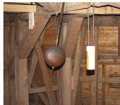
Tornets urverk från Stjärnsund har i stora stycken sin ursprungliga mekanik i behåll.