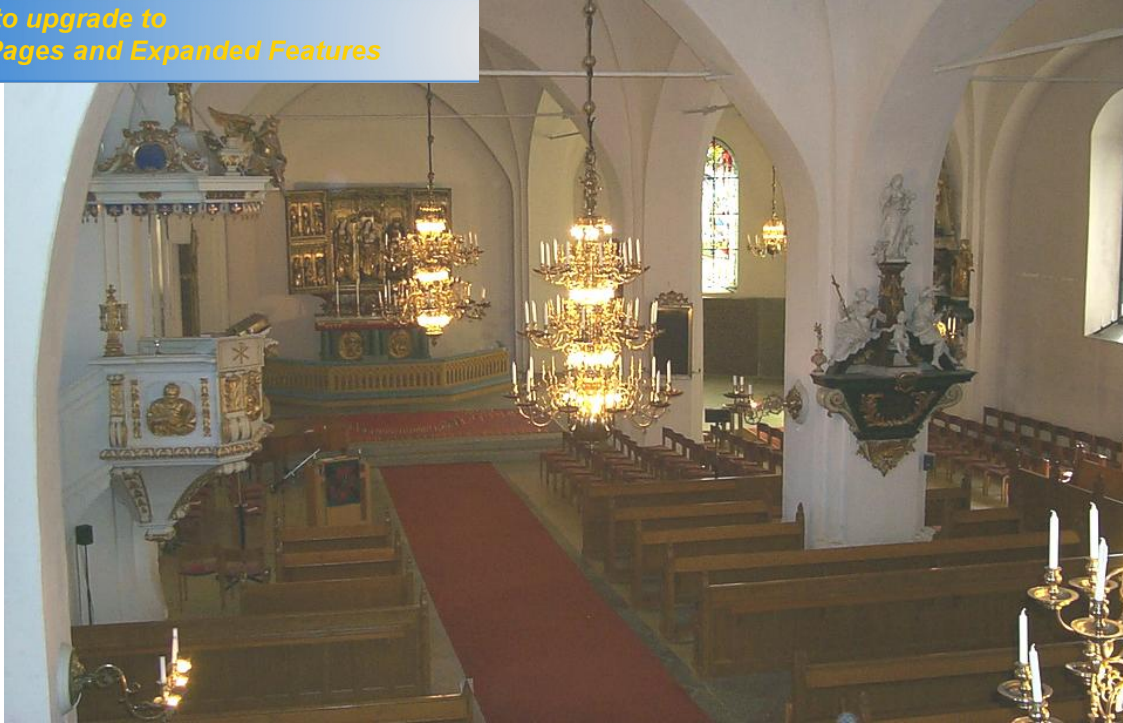
Bilden ovan är tagen från orgelläktaren mot nordost

Kyrkorummet är indelat i tre skepp, åtskilt av åtta murade, fyrkantiga pelare. Dessa bär tillsammans med tolv väggpelare och fyra hörnstöd upp sammanlagt 15 vitkalkade kryssvalv. Av dessa kvarstår mittskeppets båda västligaste från medeltiden, liksom valvet under tornet. Sparsamma målningsdekorationer förekommer i mittskeppets tre valv närmast koret. Mellan alla valvbågar finns dragjärn infästa. Väggfälten är slätputsade vita och prydda med epitafier från 1600- och 1700-talen. Fönstren har fastskruvade inre bågar med järnprofiler.