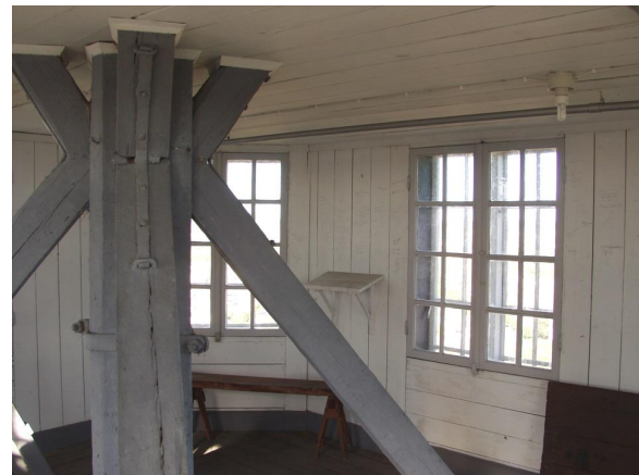
Kyrkvinden och lanterninen