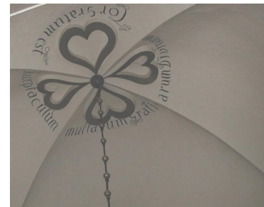
öEtt välvilligt hjärta är boningsplatsen för mycken gudomlig nåd.ö Målningen är gjord av Israel Dahl 1703

Kyrkorummet är indelat i tre skepp, åtskilt av åtta murade, fyrkantiga pelare. Dessa bär tillsammans med tolv väggpelare och fyra hörnstöd upp sammanlagt 15 vitkalkade kryssvalv. Av dessa kvarstår mittskeppets båda västligaste från medeltiden, liksom valvet under tornet. Sparsamma målningsdekorationer förekommer i mittskeppets tre valv närmast koret. Mellan alla valvbågar finns dragjärn infästa. Väggfälten är slätputsade vita och prydda med epitafier från 1600- och 1700-talen. Fönstren har fastskruvade inre bågar med järnprofiler.