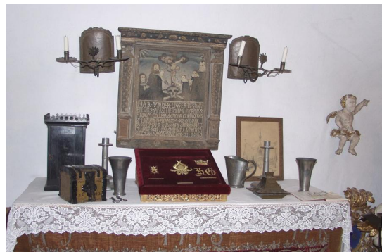
I kyrkans museum finns bland annat en snidad platta från den tidigare predikstolen, i bruk 1629-1729

Kyrkvinden är spatiös, upplyst av fönster i italianen. Förbindelse finns till tornets trappuppgång. Tornurverket har gammal mekanik bevarad och drivs av en svängande pendel. Längst upp i lanterninen är ett upplyst rum, på 1800-talet använt av tornväktare.