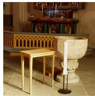
Kyrkans medeltida dopfunt står på korets norra sida. I bakgrunden ses altarringen.