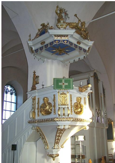
Predikstolen tillverkades 1729 av Gottlob Rosenberg. Dess uppgång är sentida. Dörren till den ursprungliga uppgången förvaras idag i kyrkans museum.

dan framför koret och framställer Jesus med alt i koret är ett stort medeltida altarskåp, bestående av mittparti, inre och yttre flygeldörrar, samt fotställning. Altaret från 1734 är murat, med kolonner indelat i fyra bildfält där evangelisterna och deras symboler finns utskurna i trä som förgyllts. Framförvarande femsidig altarring tillkom samtidigt med bänkinredningen 1880. På de nedre delarna av korets väggar sitter gravhällar från 1600- och 1700-talen, vilka tidigare låg i golvet. Korets fyra inre fönsterbågar har glasmålningar.