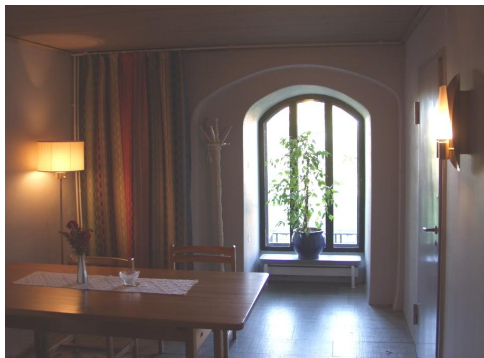
I den nuvarande brudkammaren var tidigare ett bisättningsrum

mmare, sanitetsutrymmen och vestibul inredda. Därifrån kyrkvinden. I planet ovanför brudkammaren är ett litet