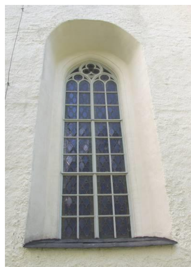
Ett av korkyrkans fönster

Davidskyrkans och Mellankyrkans ytterväggar består till övervägande delen av gråsten, liksom tornets nedre delar, medan korkyrkan och tornets klockvåning är tegelmurade. Fasaderna har spritputsats och avfärgats i en gulvit nyans; slätputs förekommer i fönstersmygarna och på två hörnpartier. Sockeln blev vid renovering 1952-53 renknackad från puts och är sedan dess bara fogstruken. Takfoten består av tjärade bräder i karnisprofil. Mellankyrkans nio fönsteröppningar är rundbågiga och sedan 1869 försedda med fönsterbågar av gråmålat gjutjärn med munblåsta, klara rutor. Korkyrkan har fem fönster, varav fyra har blyinfattade glasmålningar, tillverkade 1901-02 av Neumann & Vogel i Stockholm. I Davidskyrkans västra gavel sitter ett äldre fönster med dekorerat ramverk av smidesjärn. Tornet har en tjärad ljudlucka i varje väderstreck och kröns med en måttligt hög kopparklädd lanternin. Uppstigning i tornet sker via en enkel, panelklädd ingångsdörr på södra sidan.