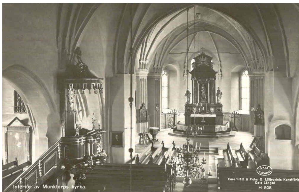
1890-92 års interiör, gestaltad av C F Ekholm, präglade kyrkan fram till 1953. Tydligaste skillnaden i förhållande till dagens kyrkorum är att bänkinredningen upptog större plats och även omfattade lågkoret.

Det sena 1800-talets förnyelse av kyrkorummet inleddes 1859 med att orgelläktare byggdes över kyrkans västra del och en 20-stämmig orgel installerades av firman Setterquist och Åkerman. En mer genomgripande förändring skedde åren 1890-92, efter arkitekt C F Ekholms anvisningar. Gravhällar från 1600- och 1700-talen togs upp ur kyrkans golv och infästes i väggarna bakom altaret. Gångarnas tidigare golvtegel ersattes med planslipade kalkstensplattor i stort format. Den slutna bänkinredningen revs ut och istället byggdes öppna bänkrader med gavlar i nygotisk stil, på nya trägolv. Valv och väggar vitlimmades. Fyra av korets fem fönster fick glasmålningar.