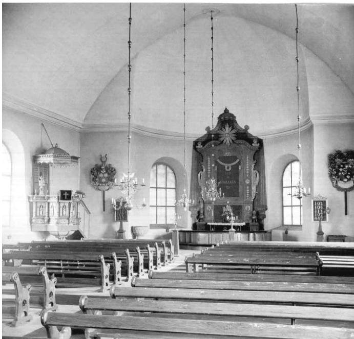
Övre bilden: Kyrkorummet omkring 1900, i den gestaltning det fick vid förnyelsen 1885. Nedre bilden: Kyrkorummet i den gestaltning det fick 1949-50 - digitala kopior av äldre vykort

En radikal förnyelse verkställdes 1885 efter arkitekt Ferdinand Bobergs anvisningar. Då insattes nya fönster med karmar och bågar av gjutjärn, samt inre bågar med rutor av matt glas. Kyrkorummets murverksytor blev genom bilning avjämnade. Valvets oljemålade panel överputsades och den nya ytan vitlimmades. Cementgolv göts överallt utom i sakristian. 1700-talets slutna bänkkvarter ersattes med öppna bänkrader som ådrades för att efterlikna ek. Samma färgsättning fick även altarring, läktare och orgelfasad. För kyrkorummets uppvärmning installerades vedeldade kaminer. Åtta år senare restes två höga skorstenar över kyrkans östra del. Dessa kom snart att kritiseras för att de gav kyrkan karaktär av industri. Ännu modernare blev exteriören 1903, då yttertakets spåntäckning ersattes med falsad plåt.