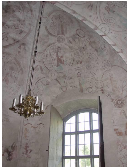
Sidokapellets valvmålningar utgörs av figurmedaljonger sammanbundna av mindre rundlar

Omkring 1200 antas att en enskeppig stenkyrka byggdes i Odensvi. På dess norra sida tillbyggdes i mitten av 1300-talet ett gravkor åt biskop Egislus och hans familj. Från denna tid finns en glasmålning bevarad. Även sakristia torde ha tillbyggts då. Under senare hälften av 1400-talet slogs sex valv över kyrkorummet som därmed blev tvåskeppigt. Senast omkring 1500 torde valven ha blivit bemålade. Vid samma tid tillkom förmodligen även en läktare framme i koret, omnämnd i visitationsprotokoll 1637. Året efter ersattes den dåvarande enkla predikstolen med en mer påkostad som alltså är i bruk.