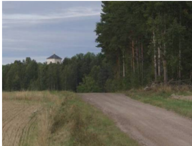
Den grusade landsvägen söder om Västra Skedvi kyrka

Kyrkbyn ligger på en höjd, där kyrka och skolhus bildar en sammanhållen miljö. Församlingens före detta klockargård och prästgård ligger intill kyrkogården 200 meter längre norrut, närmare Skedvisjön. Där fanns även den medeltida sockenkyrkan, riven 1809 då den nuvarande byggdes.