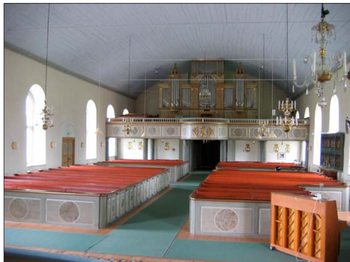
Kyrkorummet karaktäriseras idag av Jerk Altons restaurering som från 1980-talet som resulterade i en tämligen kulört interiör.