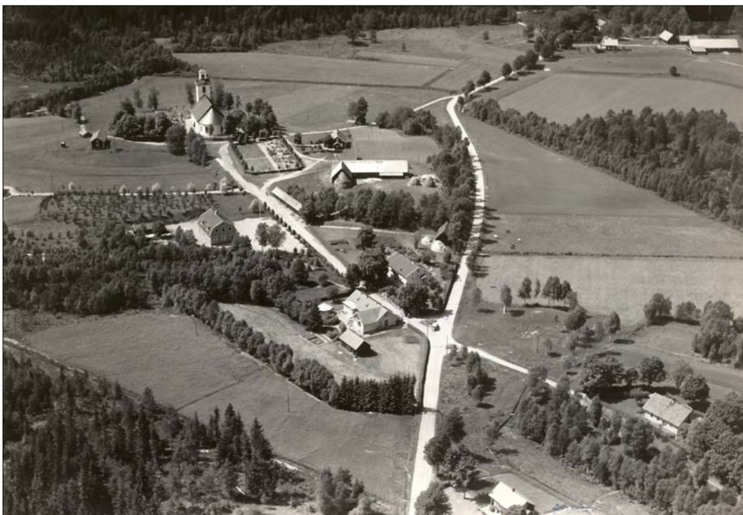
En flygbild tagen i början av 1940-talet visar hur kyrkan ligger belägen i utkanten av den samlade bebyggelsen. Sedan dess har det vuxit upp nya byggnader i anslutning till kyrkobyggnaden.

Södra Hestra socken är beläget i länets sydvästra del och gränsar bland annat mot Burseryds, Villstad och Gryteryds socknar. Kyrkan är byggd invid Hestrasjöns norra del och ursprungligen låg kyrkan och kyrkbyn lite avskilt från den omgivande bebyggelsen men med tiden har samhället krupit allt närmare kyrkobyggnaden. Kyrkogården har utvidgats vid flera tillfällen och de äldsta delarna avgränsas av en naturstensmur. Gångarna är asfalterade och grusade och gravkvarteren inramas av buskar och träd. Invid kyrkan ligger församlingshemmet, de gamla kyrkstallarna, skolhus m.m.