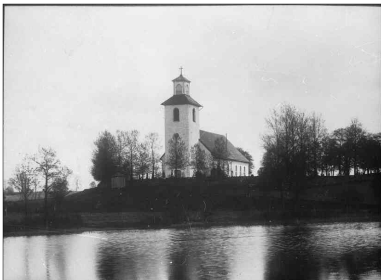
Kyrkan sedd mot väster med Hestrasjön i förgrunden.

1806 beslutades vid en sockenstämma att kyrkan skulle byggas till och under de kommande stämmorna bestämdes om utstämpling av byggnadsmaterial till ombyggnadsarbetena. Ombyggnaden lät dock dröja på sig och under sockenstämman 1826 bestämdes istället att en helt ny kyrkobyggnad skulle uppföras och församlingen vänder sig till Överintendentsämbetet i Stockholm för att få ett ritningsförslag på en ny kyrka. Ritningsförslaget upprättades av arkitekt Johan Abraham Wilelius vid Överintendentsämbetet i Stockholm och kyrkan uppfördes av byggmästaren Pehr Andersson från Västra Tåå i Sanviks socken. Det tog tre år att bygga den nya kyrkan och den placerades alldeles norr om vart den medeltida stenkyrkan stått. Det gjordes en del ändringar jämfört med de ritningar som Wilelius upprättat.