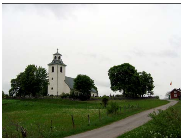
En vy upp mot kyrkan där församlingshemmet är beläget i bildens högra kant. Förutom att taket belagts med kopparplåt har få exteriöra förändringar skett kyrkobyggnaden.

renoveringar som dock har varit tämligen varsamma mot det nyklassicistiska uttrycket. I sitt nuvarande gestaltning präglas interiören av det utseende kyrkorummet gavs vid den senaste restaureringen i mitten av 1980-talet.