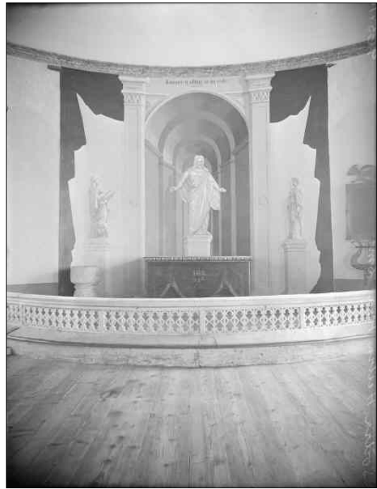
Altarmålningen efter 1927-års restaurering. Draperimåleriet tillkom 1875 och i mitten av 1950-talet får kyrkan den altarmålning som finns idag. Foto Axel Forssen, 1927.

1984-85 gjordes den senaste stora invändiga renoveringen och restaureringen av kyrkan. Efter de tidigare gjorda restaureringarna som utförts genomdrevs i mitten av 1980-talet omfattande arbeten som omfattade både exteriöra och interiöra åtgärder. Arbetena genomfördes efter program av arkitekt Jerk Alton från Kumla. Utvändigt gjordes putslagningar och kyrkan avfärgades på nytt, entré tillgänglighetsanpassades. Invändigt togs putsen ned och ett nytt bruk applicerades på väggarna innan kyrkan på nytt avfärgades. Bänkarna under läktaren plockades bort och en läktarunderbyggnad tillkom, utrymmena inreddes som väntrum, toalett samt tillkom en ny rymligare sakristia. De främre bänkarna togs bort och kring predikstolen skapade gångutrymme. Bänkinredningen målades invändigt med en röd kulör vilken fortfarande präglar bänkarna och kyrkorummet. Golvet slipades och altarringen byggdes om för att bli mer bekväm. Det gjordes även en hel del konservatorsarbeten i kyrkan.