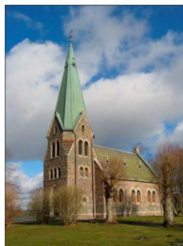
Sandviks kyrka mot sydväst. Foto Jonas Haas, 2005.

Även interiören är hållen i en konsekvent gotisk stildräkt. Murytorna är hållna i vit färg medan snickerierna har ekådring och en brun färgskala med kulörta inslag. I koret finns två glasmålningar som utgör blickfång i ett annat sparsamt smyckat kor, altarprydnaden utgörs av ett enkelt träkors. Orgelfasaden och kyrkans dopfont har en karaktäristisk gotisk utformning. Det finns få äldre detaljer bevarade i kyrkan men altartavlan från den gamla kyrkan är ett sådant exempel