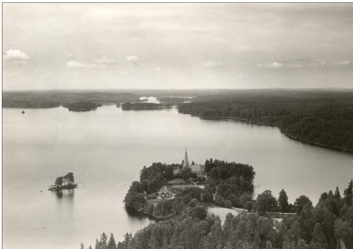
Ett flygfoto från slutet av 1940-talet visar hur Sandviks kyrka tronar ute på udden. Den gamla skolan som syns på bilden fungerar numera som församlingshem. Foto AB Flygtrafik, 1947.

Sandviks socken är beläget vid sjön Fegens östra strand. På en udde i sjön är kyrkan uppförd och har ett utmärkande läge. I kyrkans närhet ligger sockenstugan som tidigare fungerade som skola, kommunalhus och lärarbostad. Udden bildar en vik inne i vilken Sandviks säteri är lokaliserat. Socknen har en liten befolkning och landskapet består främst av skogsmark och jordbruksmark som är koncentrerad längs vägarna.