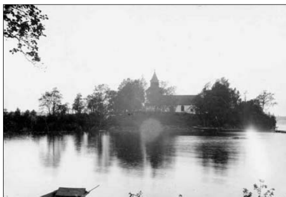
En bild av den gamla offerkyrkan taget innan branden 1896. Foto Kindblom, okänt datum. (ATA)

På kyrkans insida ersattes värmekaminerna med elektrisk uppvärmning och i samband med detta plockades golven i långhuset och koret upp och isolerades, det gamla golvet återmonterades sedan. I vapenhuset ersattes lades ett klinkergolv. Läktaren som hade en del rötskador lagades upp och mellan vapenhuset och långhuset tillkom ett vindfång med pendeldörrar mot både långhus och vapenhuset. I