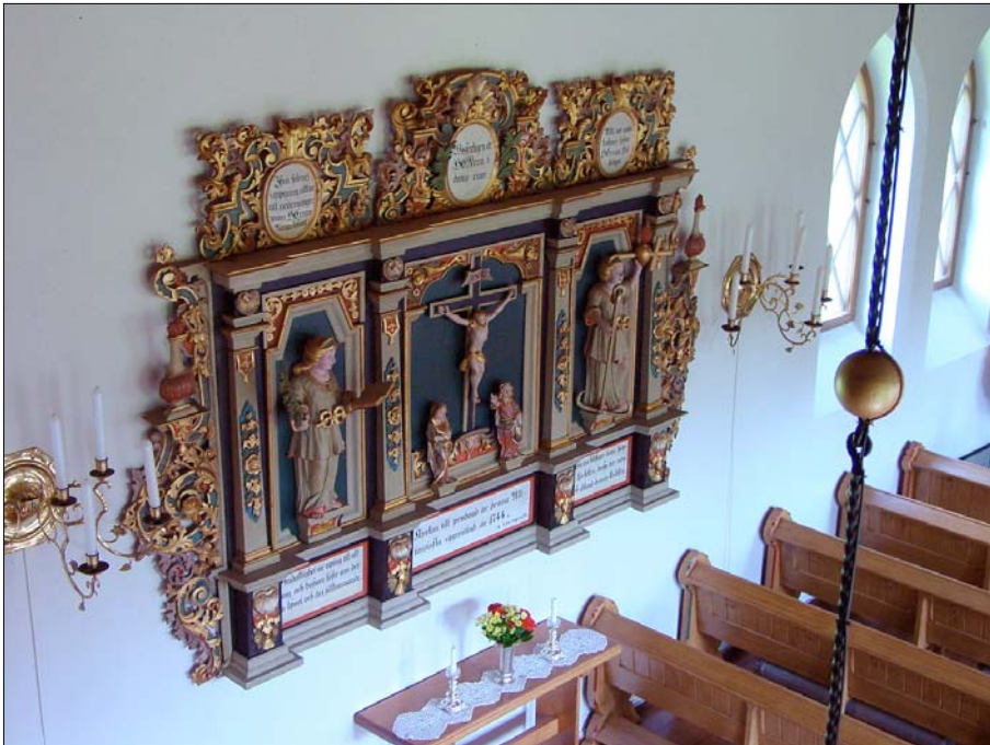
Bilden visar den gamla altaruppsatsen som placerades vid långhusets ena vägg. Altaruppsatsen tillverkades 1744 av bildhuggaren Sven Segervall.

Efter restaureringen 1950 dröjde det fram till 1985 innan nästa restaurering genomfördes. Denna omfattade främst målningsarbeten. En mindre färgundersökning utfördes av läns museet i Jönköping och färgsättning utfördes efter de resultat som denna visade. Taket och snickerierna fick en ljus ekådring med accenter i rött, grönt och blått, murytorna avfärgades i vitt. Den gamla altaruppsatsen och predikstolen genomgick konservatorsarbeten och de gamla färgskikten plockades fram. Målsättningen med denna restaurering var att återställa kyrkan till sitt ursprungliga utseende. Vid 2005 står kyrkan åter inför en restaurering där bland annat korets glasmålningar är i behov av genomgripande arbeten.