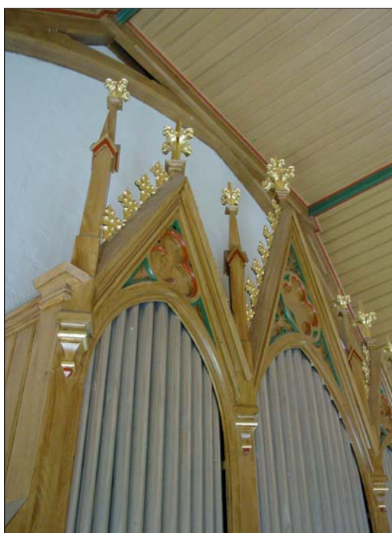
Detalj av den orgel som byggdes av Gustav Pettersson strax efter det att kyrkan färdigställdes.