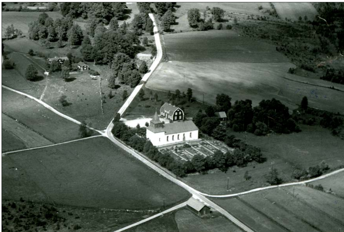
Flygbild över Kulltorps kyrka tagen under 1940-talet.

Kulltorp är delat mellan Gnosjö och Värnamo kommuner och utgörs av en kuperad skogsbygd. Inom området finns ett flertal kända fornlämningar. Rörande ortnamnets betydelse finns flera tolkningar. Kyrkan är belägen i utkanten av samhället med församlingshemmet i anslutning till kyrkan. Kyrkogården har utvidgats vid flera tillfällen och det finns en avtrappande nivå mellan de olika delarna. Den inramas av varierande material, vid delar är ett järnstaket uppfört och vid delar är finns en naturstensmur. Gravkvarteren och minneslundan är gräsbevuxna och gångarna är belagda med grus, asfalt och betongplattor. Vegetationen består av buskage, större träd som utgjort trädkrans kring kyrkogårdens äldsta delar.