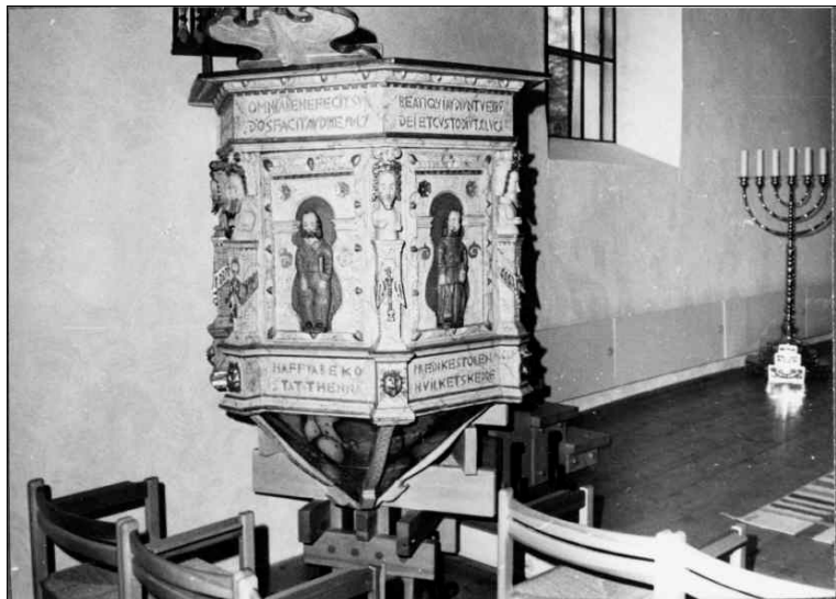
Predikstolen efter renoveringen 1968.

Någon gång under 1500-talet införskaffades en dopfunt till kyrkan. Vissa källor talar för att kyrkan år 1564 brändes av danskarna under det nordiska sjuårskriget. På 1600-talet utsmyckades kyrkan med kalkmålningar på väggarna och 1612 skall kyrkan åter bränts ned av danskarna under Kalmарkriget.