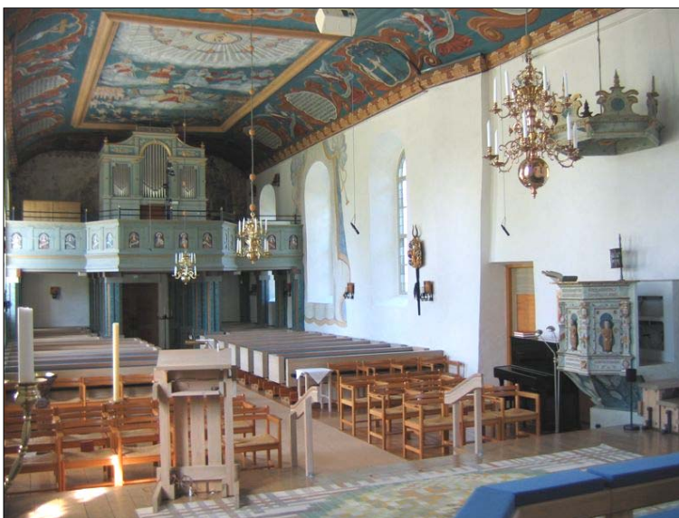
På bilden syns skarven mellan den medeltida kyrkan och 1803 års utvidgning.

År 1642 fick kyrkan sin predikstol, den bekostades av Erik Knutsson. Under slutet av 1600-talet tillkom lillklockan och mellanklockan. Tornet byggdes om 1702 och fick då en ny träöverbyggnad. Året därpå bemålades läktaren inne i kyrkan. År 1708 utfördes ytterligare arkitektonisk utsmyckning av kyrkorummet och det vara sannolikt då som draperimåleriet kring långhusfönstren utfördes. Triumfkrucifixet som fortfarande pryder koret införskaffades 1726. En större interiör ombyggnad genomfördes 1769 då ett nytt plant innertak monterades i kyrkorummet. Taket bemålades av målaren Sven Niclas Berg från Reftele. Putslagningar genomfördes på kyrkan 1778, troligtvis är det exteriöra arbeten som källorna talar om.