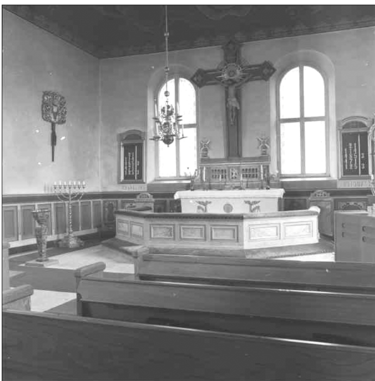
Kyrkorummet som det tedde sig efter restaureringen 1911-12. Delar av inredningen finns bevarad i tornkammaren och kyrkvinden.

En omfattande om- och tillbyggnad skedde 1803 då det gamla koret revs och kyrkan utvidgades mot öster. Ett nytt vidgat kor byggdes och samtidigt gjordes en ny sakristia mot norr och på den motsatta sidan gjordes en ny dörröppning. Källorna talar även om att tornet byggdes om. Den nya utbyggnaden belades med ekspån och 1810 täcktes kyrkan i sin helhet med ekspån, år 1814 putsades utvidgningen invändigt.