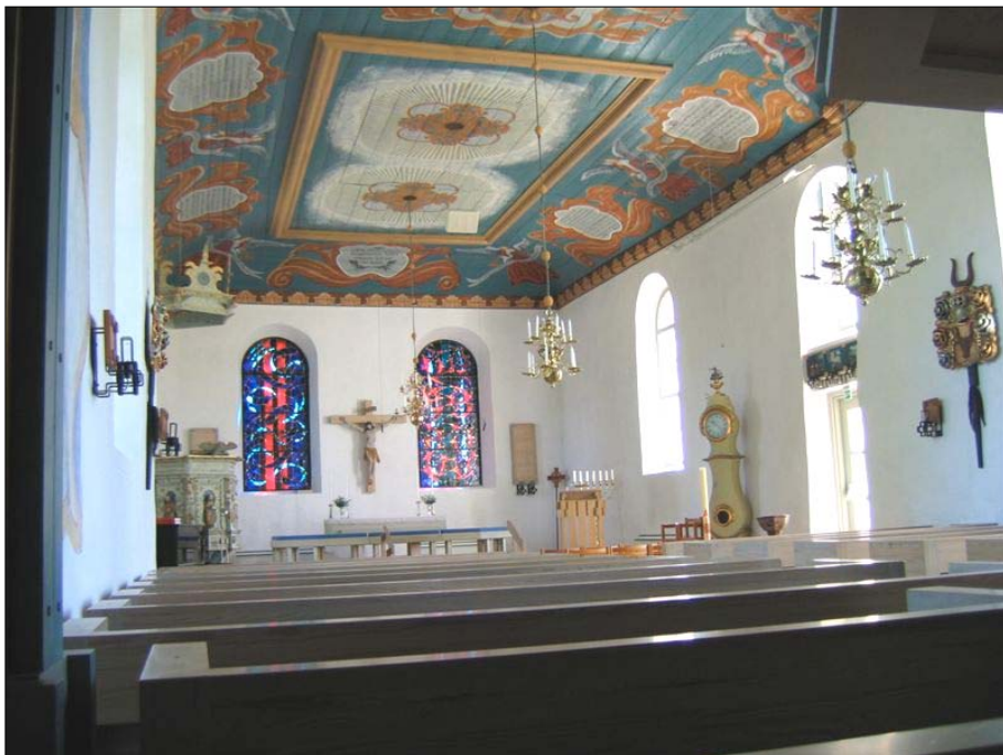
Kyrkorummet efter 1968 års restaurering. Ombyggnaden medförde en total omdaning av det invändiga uttrycket.