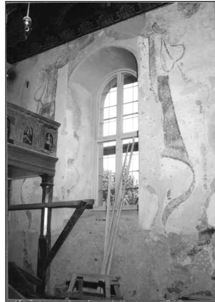
Draperimålning på norra väggen före komplettering i slutet av 1960-talet.

En ny restaurering genomfördes 1968 efter program av arkitekt Lars Stalin, Jönköping. Restaureringen var mycket omfattande och präglar fortfarande kyrkorummets uttryck. Från myndigheterna möttes omdaning med skepsis men församlingen tillsammans med arkitekten kunde driva igenom dess genomförande. Syftet med restaureringen var dels att åtgärda en del tekniska brister i kyrkan men också att skapa ett nytt uttryck i kyrkorummet. Bland de förändringar som skedde var en ny bänkinredning som gjordes med en modern och tidstypisk utformning. I samband med att bänkinredningen ersattes plockades golvet ut och en arkeologisk undersökning utfördes. I vapenhuset utfördes en ny inredning med pelare-balksystem och nya toalett- och förrådsutrymmen förlades i vapenhuset. I korfönstren tillkom glasmålningar utförda av konstnären Uno Lindberg från Eskilstuna och 1700-talsmaleriet plockades fram och rengjordes. En utvändig och invändig ommålning utfördes och det finns källor som talar för att kyrkan utvändigt kan ha målats med färg från KEIM.